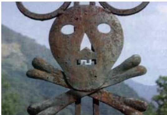
I Sør-Sveits var hodeskallen et symbol for fare og et tegn for vern mot naturkreftene (etter Møllerhaug 2003:12).

I Dag og Tid lørdag 9 august 2003 er vi presentert for et bygde-Norge som et langstrakt Twin Peaks som holder på å gro igjen. Den klare motsetning er det turistperfekte Heidi-landet Sveits med glade kyr og grunneierlag som eier alt i fellesskap og har et felles ansvar for at bygdas kulturlandskap kan ivaretas gjennom vedlikehold av driftsformene i landbruket. Overalt i alpefjellene i Sør-Sveits finnes det spor fra fortiden på husvegger, langs stier og i utmark. Det er etterlevninger fra generasjoner som har opplevd hungersnød, sprengkulde, isolasjon, og drap. Det er knyttet legender til tegn som minner folk om hendelser i landskapet. Alpene er fylt av kulturmiljøer med menneskeskapt merker som tas vare på for å gjøre det mulig for folk å huske farene og forstå nødvendigheten av å kunne lese landskapstegnene ikonografisk. Vi står overfor en kulturell overlevelsesstrategi og tradisjonsoverføring i forhold til naturen, en særlig type kulturforståelse som er utviklet med tanke på framtidens generasjoner. I Norge har vi flere typer medforvaltere som aktører og brukere av landskap. Vi har et statlig, fylkeskommunalt og kommunalt organisert hierarki med et byråkrati som skal ivareta fellesverdiene i landskapet for allmennheten. Hvordan forstår aktører og brukere forvaltningen av landskapet, og hvordan er det med overlevelsesstrategien og tradisjonsoverføringen av kulturforståelse som muliggjør felles lesning av landskapet for de neste generasjoner?