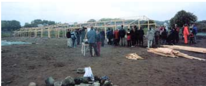
Kunnskap er grunnlaget for forståelse. Det kan være vanskelig å forestille seg forhistoriske hus ut fra stolpespor i undergrunnen. I forbindelse med Hundvågprosjektet ved Stavanger ble et langhus fra romertid rekonstruert tredimensjonalt ved å vise prinsippet for reisverket på arrangementet "Åpen dag" i 2001.

Revisjonen av plan- og bygningsloven gir en status over vern av kulturminner og kulturmiljøer som er basert på det visuelt erkjennbare der estetiske hensyn er gitt høy verdi. Estetikk og byggeskikk er gitt en særlig behandling i et underkapittel (jf. delutredningens punkt. 7.22). Vi kan forutsette at det i framtiden vil bli et stort behov for forvaltere med en type kulturforståelse som dekker dette feltet. Uttalelsen fra planutvalget forholder seg imidlertid til et forenklet og redusert bilde av realitetene i dagens landskap i by, tettsted og på landet. Det er i et langsiktig perspektiv nødvendig med en synliggjøring og presisering av de ikke-estetiske verdiene ved kulturminner og kulturmiljøer. Dette er ingen enkel oppgave fordi det kan være vanskelig for folk å forstå det de ikke kan sanse.