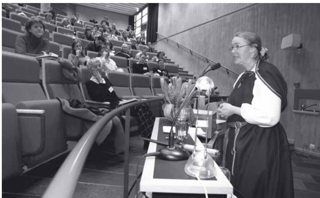
Fig. 1 (a og b). Husfruen fremstilt av forfatteren.

Dersom dere kom til en storgård i folkevandringstiden, ville dere kunne møte en kvinne som bar en stor, forgyldt spenne og hadde nøkler i beltet. Og hvis dere møtte henne, ville dere visst hvem hun var. Eller dere ville visst hvilken rolle hun var tiltenkt i samfunnet. Dere ville visst at hun var husfrue på en storgård. Kanskje ville dere ha hørt henne, hørt den byden som ble assosiert med henne – nøklene som klinger i beltet.