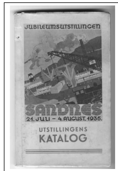
Figur 6: Utstillingskatalog 2

I jubileumsukene ble det arrangert bilturer til områdene rundt Sandnes. Publikum kunne betale for en tur til en av Jærstrendene, eller til andre steder, alt fra Moi til Hafrsfjord. Priser og turtilbud var opplistet i den lille katalogen. Den inneholdt også fremstillinger av ulike sider ved byen. Tre av artiklene het ”Sandnes – Jærens port”, Leirindustrien i Sandnes” og ”Trek fra håndverkets stilling i Sandnes”. 222 I tillegg ble byens kommunikasjonsforhold, ullvareindustrien, bankvesenet, byens økonomiske stilling, meieridriften, handelen, jernindustrien, møbelindustrien og elektrisitetsverket presentert i egne kapitler. Det er de ulike artiklene om Sandnes som vil bli analysert her. Den delen av utstillingskatalogen bestod av rundt 100 sider, men omtrent halvparten av disse var fylt med annonser. Artiklene varierte fra to til syv sider, og var skrevet av