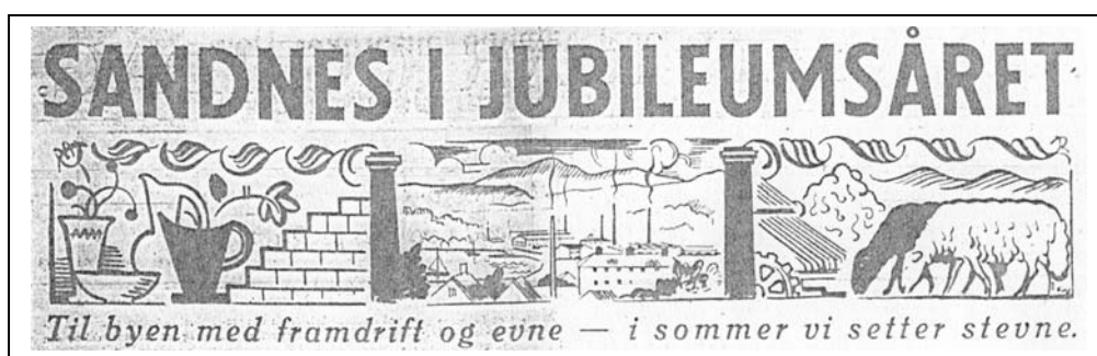
Figur 3: Iste Mai sin logo over artikler og annonser fra Sandnes i 1935