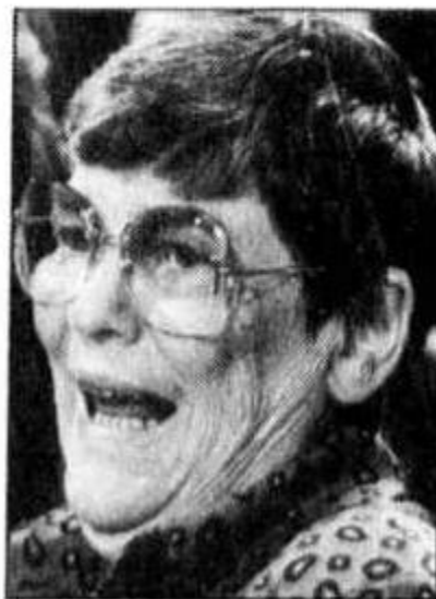
SVs Hanna Kvanmo.

Den 22. Juni 1989 vart eit farvel-dikt, skriva av ein lesar i Aftenposten, publisert. 183 I 1990 vart Hanna Kvanmo pensjonist og har truleg difor tittelen «Farvel, Hanna». Diktet summerer opp typiske særtrekk ved Hanna Kvanmo som politiskar. Ho var munnrappe og var ofte snar og gje eit svar eller ein kommentar på spørsmål og utsegn. Hanna Kvanmo var ein friskus på den måten at ho var fritalande, hadde ofte ein god replikk og var ein frisk pust på Stortinget til skilnad frå andre politiskarar. Til og med Hanna Kvanmo sin argaste politiske motstandar Kåre Willoch sa at ho var «en som skilte seg fordelaktig ut frå andre politiske motstandere». 184 Utsegnet er forsiktig og rosar ikkje Hanna Kvanmo noko særleg, men det var likevel eit slags kompliment. Dette viser at til og med Hanna Kvanmo sin politiske motstandar sa noko positivt til og det ville ikkje Willoch ha gjort i 1974.