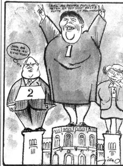
Hanna Kvanmo jubler. Hun er den politiker Norge liker best. På en måling fra Gallup/NOI «scorer» hun bedre enn både statsministerkandidat Rolf Presthus og statsminister Gro H. Brundtland. Side 3