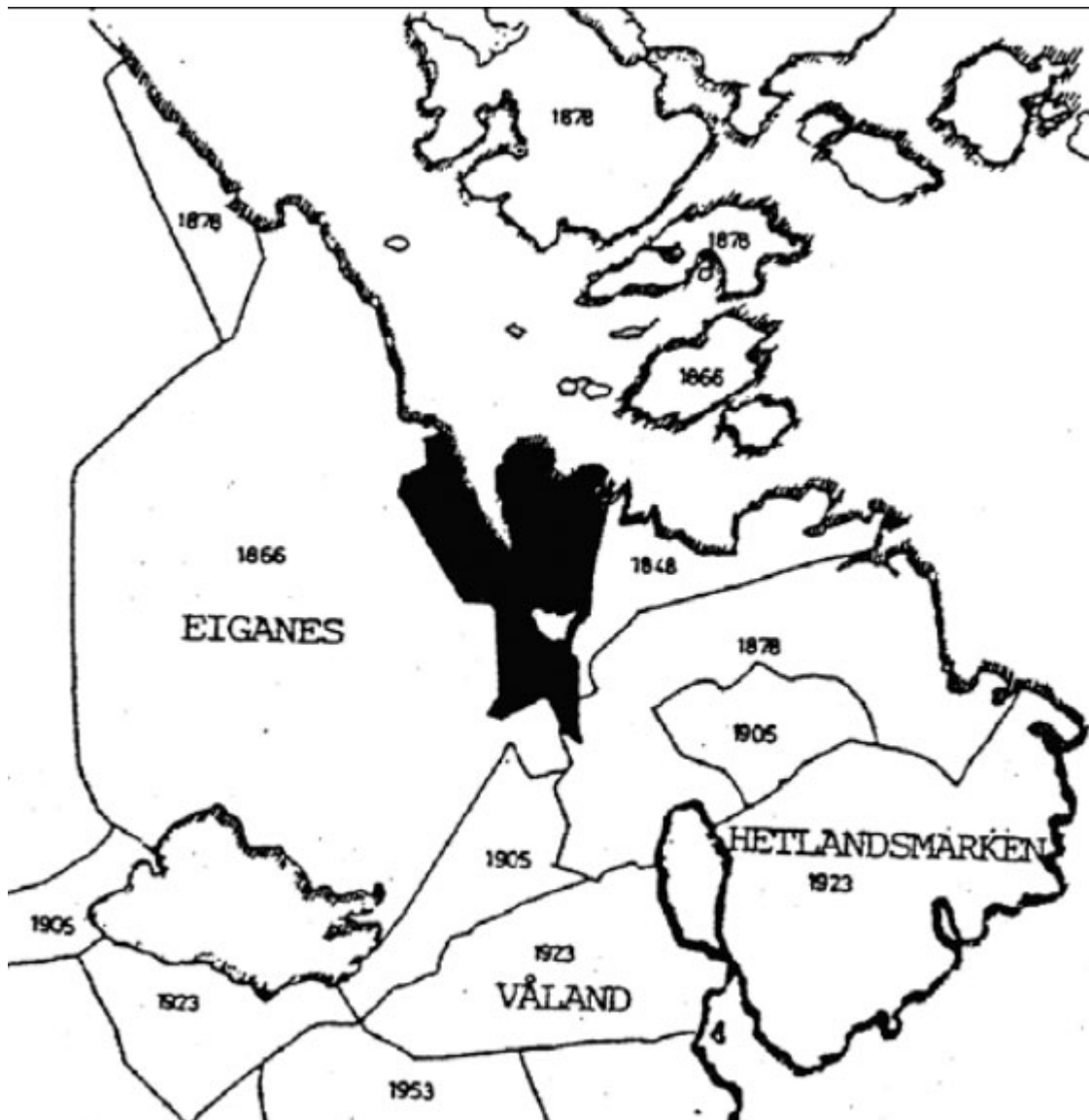
Kart 1: Stavangers byutvidelser. 140

Storhaug bydel, folkerike områder hvor det bodde mange utenlandsfødte, som en oversikt senere i dette kapittelet viser.