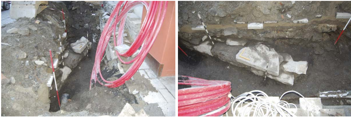
Figur 2 og 3: Rest av mur påvist i grøfta ved Kongsgata. Fig.2 (til venstre) foto mot V. Fig. 3 (til høgre) foto mot S.

Rett vest om inngangen til Handelens Hus blei det påvist restar av ein steinmur (jf. Fig. 2, 3). Denne var utan sement eller mørtel som bindemiddel, bevart i høgda i to omfar og gjekk på skrå gjennom grøfta. Det verka som at anten ein tidlegare grøftrasé her eller bygginga av sjølv Handelens Hus har kuttet vekk den nordvestlege delen av muren, for den eine enden på muren var synleg innan grøfta. I motsett retning heldt muren fram inn i den sørlege grøftprofilen. Den øvste delen av muren låg ca 40 cm under dagens overflate, dei nedste steinane kvilte på det mørke "søppellaget", ca 80 cm under dagens overflate. Dette laget fanst også på innsida av muren, dvs mot grøftprofilen i sør, og her låg laget noko høgare oppe. Dette kan tyde på at muren tilhøyrer ein konstruksjon som var delvis skoren ned i det mørke kulturlaget. Muren var bevart i ei høgde på ca 40 cm og ei synleg lengde på ca 3,00 m. Etter at det var blitt laga ei grov teikning og utført diverse oppmålingar og fotografering, fjerna ein den delen av muren som var i vegen for røyra i grøfta.