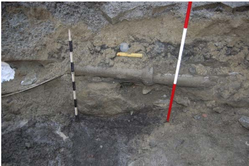
Figur 1: Døme på mørkt kulturlag i grøfta ved Kongsgata, her ca 5 m frå Klubbgata. Foto mot S.

Fleire stadar langs traséen støytte ein i botnen av grøfta på eit kulturlag av mørk, seig og kompakt masse, med tydleg innslag av nedbrote organisk materiale, raud tegl og 1700-/1800-tals keramikkskår (jf. Fig 1). I samråd med sakshandsamar på AmS vart det avgjort at dette laget