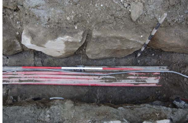
Figur 4 og 5: Rest av mur i grøft ved servicekontoret. Fig 4 viser foto mot Ø, Fig 5 viser mur og helle i botnen, foto mot N.

Sidan gravemannskapa allereie hadde lagt ned røyra i denne delen av grøfta før arkeologen kom, var det vanskeleg å få fullgodt oversyn over tilhøva. Men ettersom røyra kunne leggest ned og grøfta fyllast att utan at ein måtte fjerne verken steinane i muren eller hella i botnen, valde ein å berre dokumentere situasjonen ved hjelp av foto og skriftlege notatar. I samråd med sakshandsamar på AmS vart muren vurdert til ikkje å tilhøyre eit frede fortidsminne, men heller eit hus frå dei siste hundreåra.