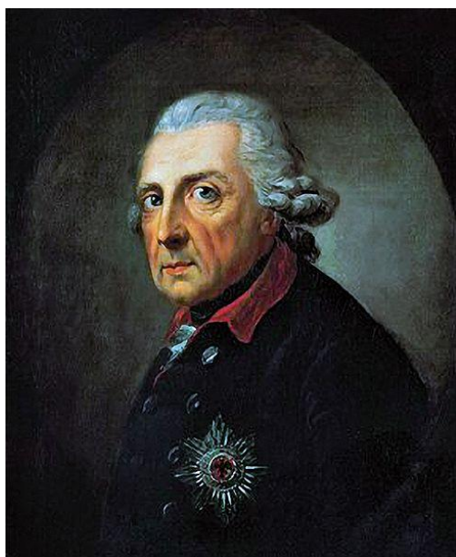
Portrett av Frederik II av Preussen, fra 1781.