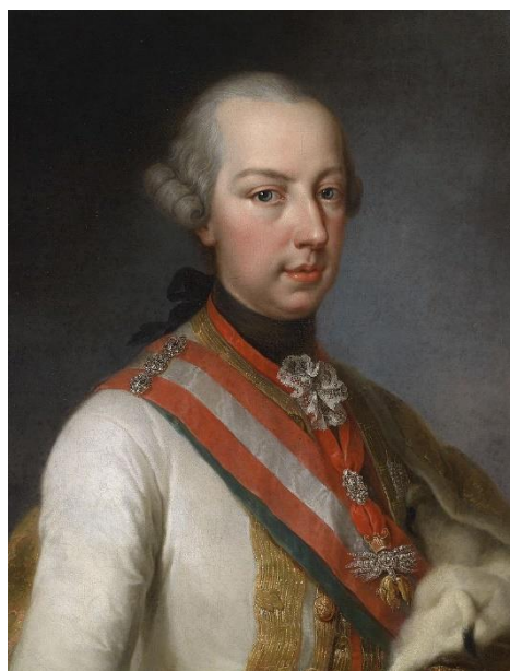
Portrett av Joseph II av Østerrike, fra 18-århundre.