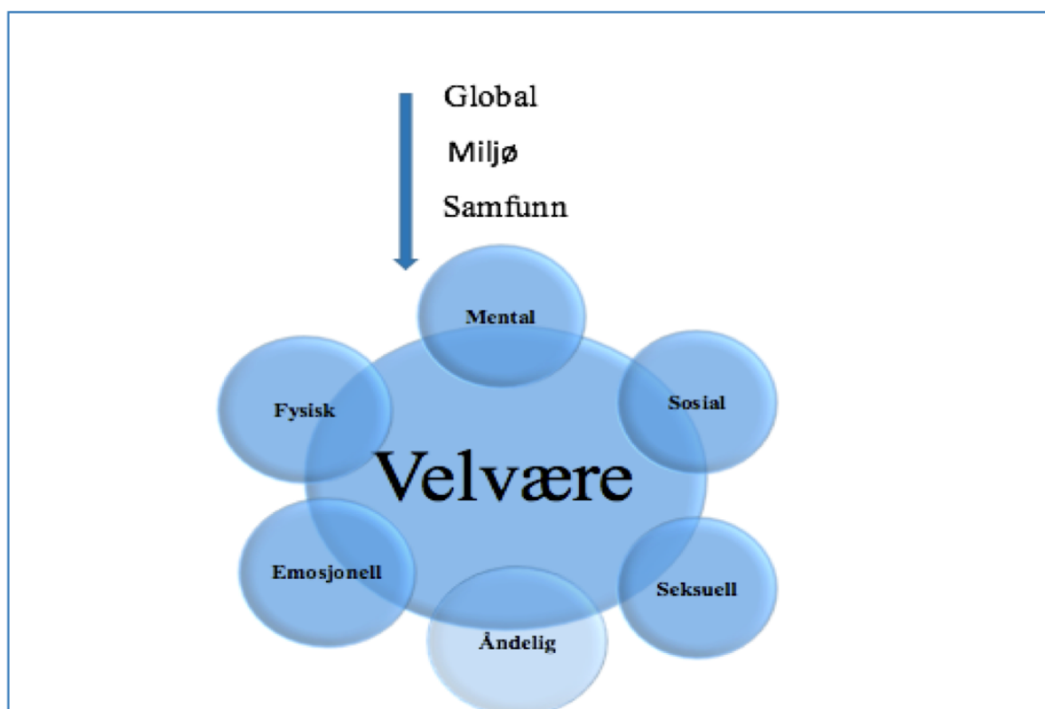
Figur 3. Dimensjoner av helse (Naidoo & Wills, 2009)

Ved å legge til grunn en positiv tilnærming, vil en rekke indre og ytre faktorer påvirke et individs helsetilstand. Det kan både være et individs personlige egenskaper, så vel som faktorer fra omgivelsene (Naidoo & Wills, 2009). For eksempel kan kritiske livshendelser raskt endre et miljø for mennesker, og i følge Theorell (2003) bør virkningene vurderes ut fra et psykologisk og sosialt perspektiv. Psykososial er da et begrep som er mye brukt, men sjeldent er definert. Det har blitt trålt gjennom mengder av litteratur for å finne en god definisjon, men svært få og entydige kommer fram. Det kan ha en sammenheng med at psykososial blir brukt i ulike sammenhenger og kontekster som kan være overskridende og blir brukt om en annen. I litteraturen finnes det begreper som psykososial(e/t) miljø, -arbeid, -problemer, -risiko, -dysfunksjon, -faktorer, -tiltak, -beredskap, -utvikling og mange fler.