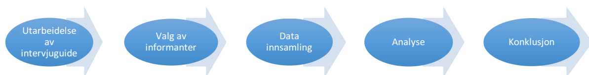
Figure 2 - Forskningsprosessen

Figur 2 illustrerer forskningsprosessen til forfatteren, og i følgende underkapitler vil det bli