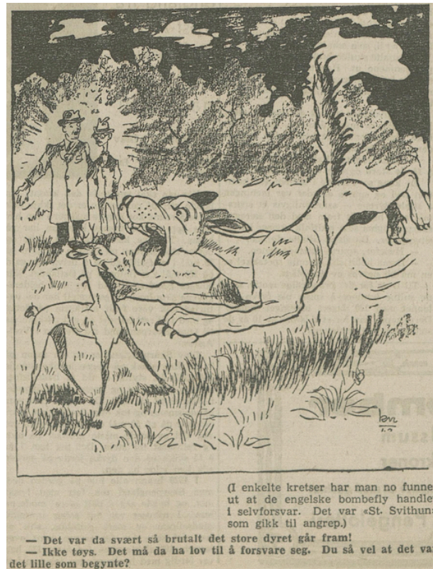
Bilde 7: Britiske bombefly i selvforsvar. 184

sammenligne «Sanct Svithun» med et lite og uskyldig rådyr, mens de britiske flyene sammenlignes med en aggressiv hund. Tegningen kan også virke som en metafor for Norge og England, der det lille rådyret forestiller Norge, mens hunden forestiller England. Derfor passer tegningen inn i fiendebildepropagandaen til NS.