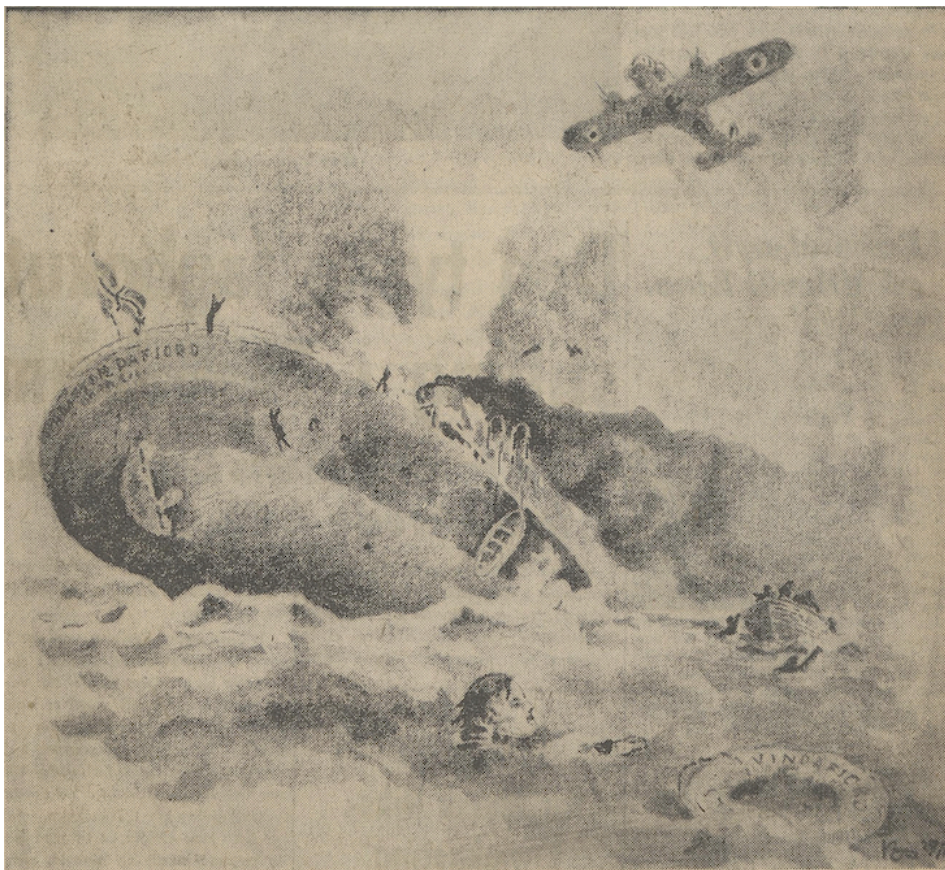
Bilde 4: England myrder atter på norskekysten. 142

NS eget avisorgan Fritt Folk skildret angrepet første gang 1. desember 1941 med en stor overskrift på avisens forside: «England myrder atter på norskekysten. Ruteskipet «Vindafjord» senket og 29 landsmenn omkom. Bomber og mitraljøser gjorde sitt blodige arbeid blandt de ulykkelige.» 141 Ved siden av denne iøynefallende overskriften er forsiden av utgaven preget av en stor tegnet illustrasjon av angrepet. Tegningen viser et synkende skip i brann, hvor akterskipet stikker opp av vannet, mens baugen står under vann. På akterskipet pryder navnet «Vindafjord», og det norske flagget flagrer i vinden på skipets flaggstang. Tegningen viser mennesker som hopper fra akterskipet og ut i vannet, og den viser mennesker som klamrer seg fast til drivverk og livbøyer i vannet. På den ene livbøyen som flyter i vannet, står også navnet «Vindafjord». Øverst på tegningen skildres det britiske bombeflyet som forårsaket det hele, som i følge avisene er av typen «Lockheed-Hudson».