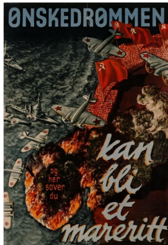
Bilde 2: Ønskedrømmen (Før 1945) 131