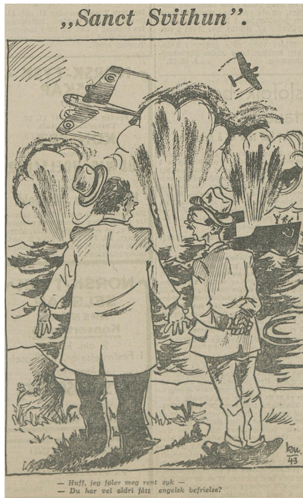
Bilde 6: «Sanct Svithun». 181

Den andre propagandategningen hadde et annet formål. Den forsøkte ikke å undergrave selve handlingen, men heller undergrave påstander om hvorfor angrepet skjedde. Tegningen er av de samme to mennene fra første tegning. Denne gangen er de vitner til at en stor hund angriper et lite og stakkarslig rådyr. Dialogen under bildet sier: «Det var da svært så brutalt det store dyret går fram!», «Ikke tøys. Det må da ha lov til å forsvare seg. Du så vel at det var det lille som begynte?» Under bildet står det også følgende i parentes: «(I enkelte kretser har man no funnet ut at de engelske bombefly handlet i selvforsvar. Det var «St. Svithun» som gikk til angrep.)» 182 Her prøver illustratøren å undergrave et argument om at «Sanct Svithun» angrep de britiske flyene først. Noe som kan ha vært tilfelle, siden tyskerne forlangte at flere norske handelsskip og passasjerskip skulle bevæpnes med mitraljøser. 183 Gjennom sarkasme forsøker illustratøren å fremstille dette argumentet som helt absurd, ved å