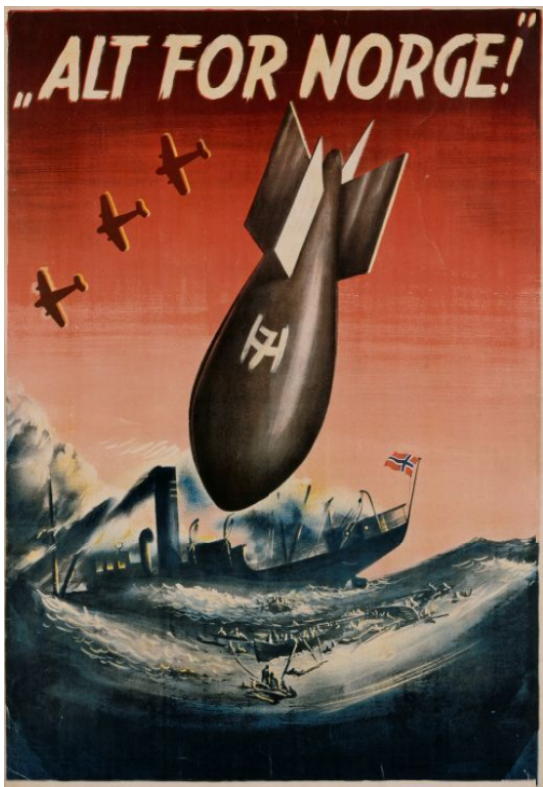
Bilde 1: «Alt for Norge!» (1941 eller 1944) 130

film, derfor fokuserte innslaget på et protestmøte som ble arrangert etter hendelsen. 128 Senere filmrevyer kunne vise de fysiske skadene forårsaket av angrep, slik som ved det allierte bombeangrepet på Norsk Hydros aluminium- og magnesiumproduksjonsanlegg på Herøya. Der forårsaket bombene store ødeleggelser, og 57 sivile ble drept. Ødeleggelsene ble filmet og vist frem i en reportasje i 1943. 129 For filmrevyen var nok allierte angrep på norsk jord en større ressurs til propaganda enn det angrep på hjemmeflåten var, siden angrep på hjemmeflåten som regel ikke etterlot noen fysiske ødeleggelser som kunne vises på film.