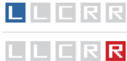
Figur 3: Kan finnes på samme URL som figur 2.

spørreundersøkelser. 24 Resultatet av rangeringen vil så bli vist på følgende måter, som vist av figur 3. Den øverste delen av bildet viser en avis som er blitt rangert som en tydelig venstrelenende avis mens det nedre bildet viser en avis som er rangert som en tydelig høyrelenende avis. På samme vil en rangering i sentrum bli definert som sentralt partisk, eller en avis som ikke lener tydelig i den ene eller den andre retningen.