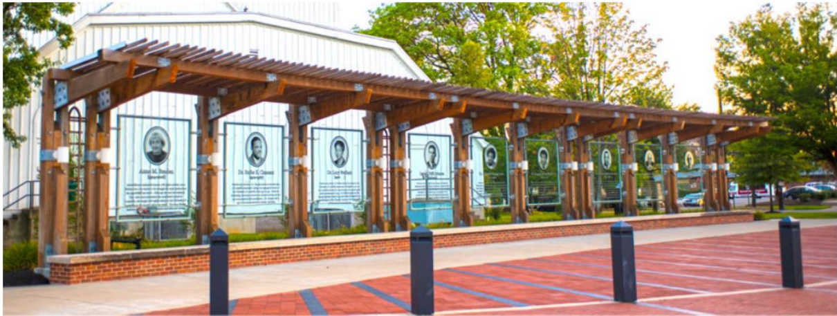
Freedom Park, Louisville, Kentucky.

Jim Crow.» 54 Denne holdningen ble endret nettopp da hun så et eksempel der kontekstualisering ikke fungerte.