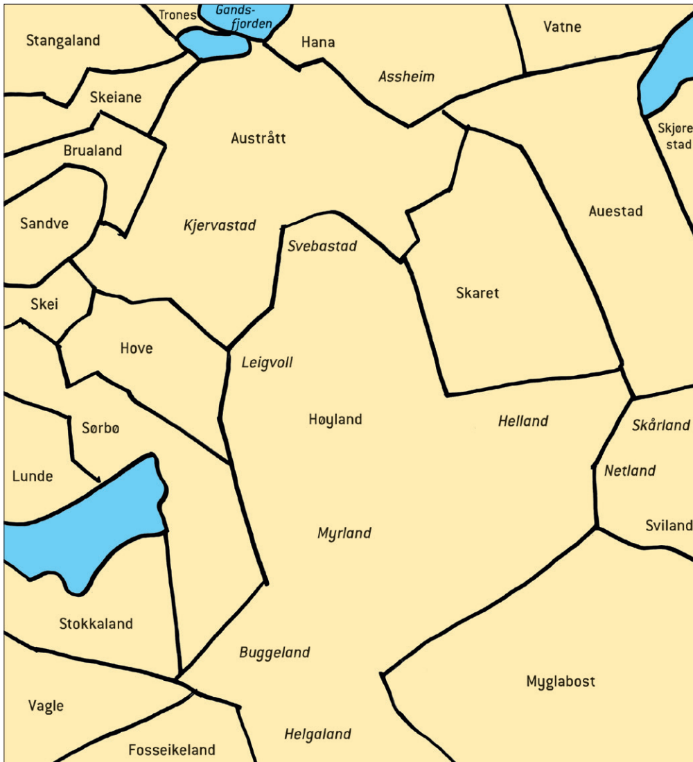
Fig. 5. Stadnamn på og omkring gardane Hove, Sørbo, Lunde og Høyland i Sandnes. Kart ved Inge Særheim, Elna Siv Kristoffersen og Ingund Svendsen, Universitetet i Stavanger ©.

Fig. 5. Place names on and in the vicinity of the farms Hove, Sørbo, Lunde and Høyland, Sandnes. Map by Inge Særheim, Elna Siv Kristoffersen and Ingund Svendsen, University of Stavanger ©.