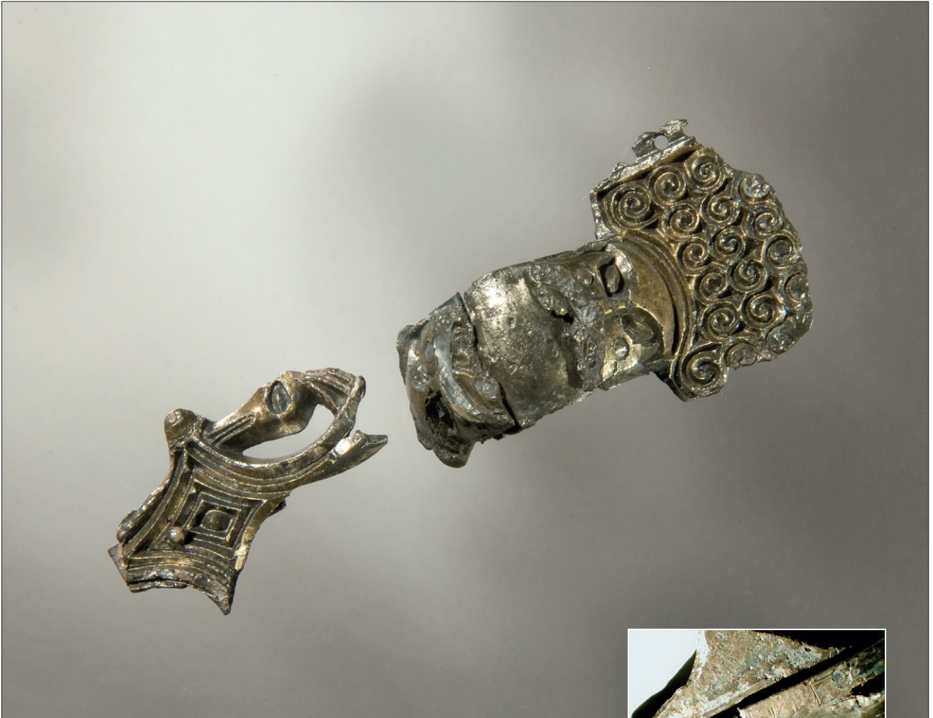
Fig. 1. Relieffspenne av forgylt sølv frå Ådnhaugen på Tu, med runeinnskrift. Fig. 1. Silver-gilt relief brooch from Ådnhaugen, Tu, with runic inscription.

Tinghaug , nytta om den høgaste toppen på Tu, er gammalt, noko som ikkje synest urimeleg, speglar også det den politiske og rettslege posisjonen til denne staden; det kan i så fall seiast å vera eit sentralplassindikerande stadnamn. Etter alt å døma var dette eit område med rettslege og politiske funksjonar også i førhistorisk tid. Det krinsforma tunet på Dysjane (Hauge) er eit synleg merke på den spesielle posisjonen som denne staden har hatt i eldre jernalder når det gjeld politisk makt (Grimm 2010:76–79, Grimm & Pesch 2010:13–17). Eit tilsvarande tun på Reiestad (Varhaug) er kalla Leksaren . Kanskje inneheld dette namnet ordet leik , gno. leikr m., jf. Leikvoll , Leikvang o.l., med bakgrunn i tevlingar i samband med tidlegare samankomster og kanskje sakrale handlingar. Ei mogleg tolking kan vera gno. *Leiksgarðr , samansett av gno. leikr m. og garðr m. 'gard, gjerde', jf. liknande lydutvikling i etterleddet i Kjengaren , som er gno. *Hjalmgarðr , brukt om gamle lagringsstader for høy, korn o.a. (Særheim 2002:382–384).