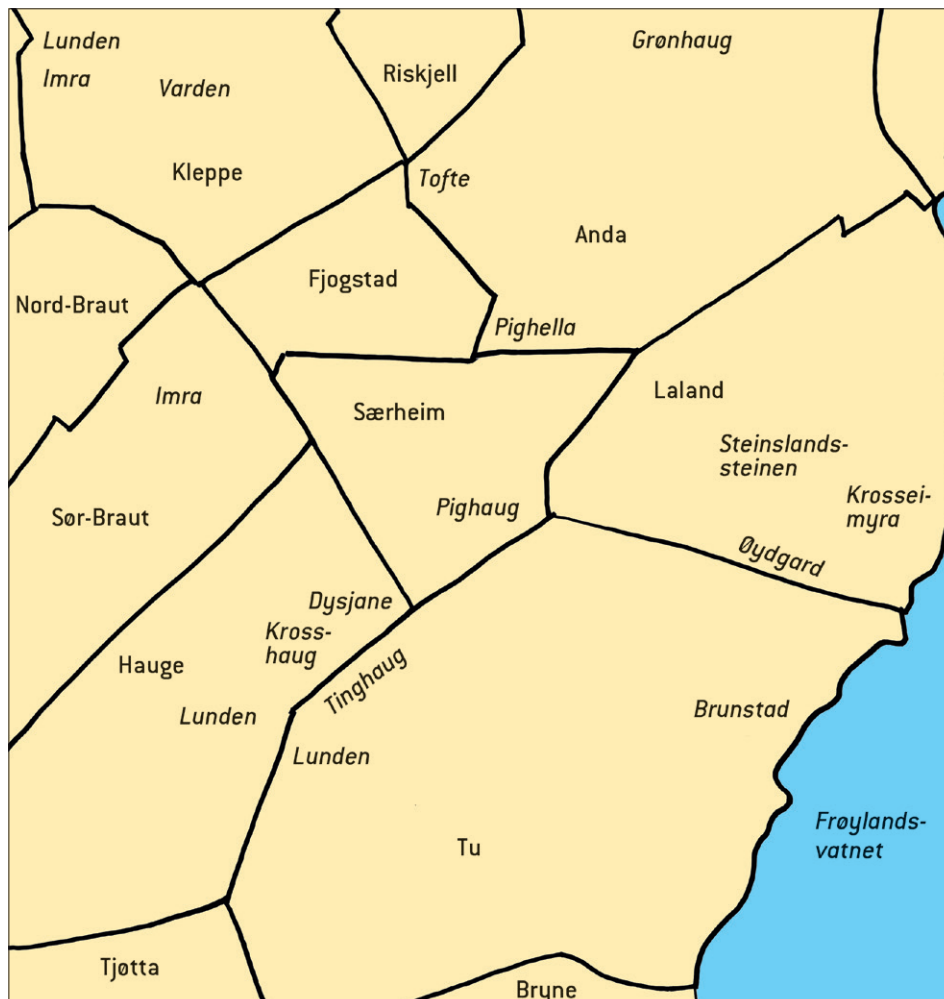
Fig. 2. Stadnamn på og omkring gardane Hauge og Tu i Klepp. Kart ved Inge Særheim, Elna Siv Kristoffersen og Ingund Svendsen, Universitetet i Stavanger ©.

Gardsnamnet Tu /tu:/ er skriva Twff 1519, Tw 1521, Thuff 1563 og Tough 1567. Gammalnorsk form er *Þúfr . Det er laga til eit appellativ som ikkje er belagt i norrønt, men som førekjem i norske gardsnamn. Det svarar til nyno. tuv m. 'topp, knute, spiss høgd på flate', jf. òg den svake forma nyno. tuve f. (Rygh 1915:128–129, Særheim 1980:76). Real bakgrunn for gardsnamnet er den godt synlege toppen Tinghaug, som er den mest