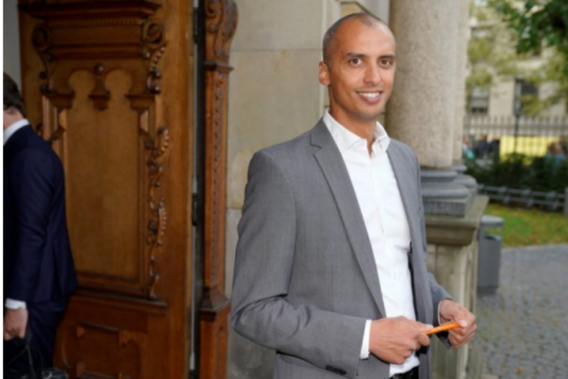
Danmarks innvandringsminister Mattias Tesfaye.

Danmark og Rwanda står sammen om å endre dagens «urettferdige» og «uetiske» asylsystem.