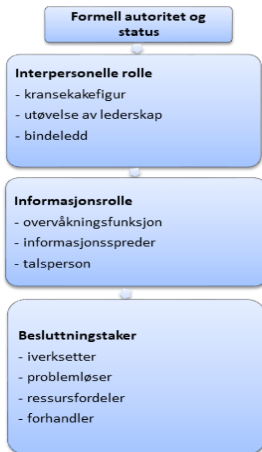
(Figur 2. Ledernes roller og oppgaver, fritt oversatt og gjengitt fra Mintzberg, 2009, s. 45, Mintzberg, 2010, s. 73, etter Mintzberg, 1973, s. 59).