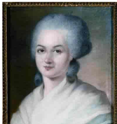
Illustrasjonsbilde 10 - Marie Olympe de Gouges

I denne læreboken er ikke dette snakk om et stort antall kvinner, hverken navngitte eller som kollektiv, som faller inn under kategorien kvinnekamp . Kvinners lange kamp for et mer likestilt samfunn, og ikke minst stemmerett, er ikke særlig vektlagt i denne læreboken. Under kategorien «Mangfold av kvinneroller» vil vi kunne se at læreboken tar for seg kvinners rettigheter i ulike perioder, men det blir i liten grad beskrevet en kamp for å oppnå mer, og vil derfor ikke bli beskrevet i denne kategorien. Marie Gouze er en kvinne som blir omtalt i forhold til kvinners ønske om økte rettigheter