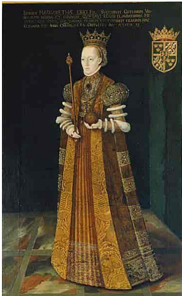
Illustrasjonsbilde 2 – Dronning Margareta

Det er hele 13 navngitte kvinner i denne læreboken som passer i denne kategorien. Noen er mer relevante og utypet enn andre. Anne Boelyn, Katarina av Aragón og Maria (Edvard 6. søster) er eksempler på monarker som kun blir nevnt ved navn og ikke utypet 70 . Både Elisabeth 1. og Maria Stuart blir også i denne læreboken omtalt og utypet. Ut ifra lærebokens beskrivelser om Elisabeth 1. kommer det fram at tross hun var kongelig og velutdannet, hadde hun ikke bare ett lett liv. Hun beskrives i læreboken som « dyktig og intelligent », samtidig som at det står skrevet at hun var « hensynsløs mot alle som sto i veien for henne ». 71 Om Maria Stuart får vi vite lite, og beskrivelsen under underoverskriften « Maria Stuart-Skottlands dronning, katolikkenes samlingsmerke », behandler teksten Elisabeth 1. i større grad enn Maria Stuart. Det kommer derimot fram at Elisabeth 1. « fryktet » Maria Stuart og at hun « hadde mer politisk sans enn sin «søster» » 72