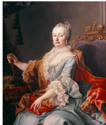
Illustrasjonsbilde 1 – Maria Theresia (Meytens, 1759)

Maria Theresia blir presentert som en keiserinne av Østrike i kapittelet Nytiden. 49 Om henne fortelles det at hun var med på å samle et krigsforbund mot Preussen, men ut over dette domineres fortellingen om Fredrik 2. En beskrivelse som stikker seg ut, og som er grunnlaget for at hun blir nevnt i denne analysen, er disse setningene: « Maria Theresia hadde vanskelig for å komme over dette tapet. Hun gråt hver gang hun så en schlesier, sies det. » 50 Det at hun gråt er nok en beskrivelse som har blitt gjort for å understreke hvor tungt hun tok tapet av sine landområder. Forfatterne kunne ha latt være å ta med denne setningen og fortsatt fått samme resultat i den korte beskrivelsen av henne. Denne beskrivelsen gjør at hun kan oppfattes som svak, og det er ikke slik mannlige ledere blir beskrevet i denne læreboken. Om det hadde stemt at Fredrik 2. eller hvilken som helst annen mannlige historisk figur hadde grått hver dag av samme grunn, hadde det nok det blitt utelatt. Menn er nok, og var nok også på den tiden, like følsomme som kvinner, men fra 1800-tallet har vi sett på menn som viser