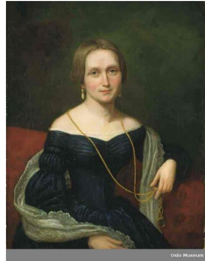
Illustrasjonsbilde 3 - Camilla Collet (Görbitz, 1839)

Flere internasjonale kvinner som var store bidragsytere i kvinnekampen blir presentert, blant annet Eveline Pankhurst og beskrivelser av suffragettebevegelsen 81 , men forfatterne har lagt et enda større fokus på kvinnekampen i Norge. Camilla Collet blir beskrevet i denne læreboken som kvinnesakens mor. Senere kommenteres det at « Tvert om tok Camilla Collett direkte avstand fra den egentlige kvinnesaken ». Hva forfatteren mener med dette er utydelig. Ifølge teksten skal hun i liten grad ha kommentert kvinners ekteskapelige rettigheter, og at hun ikke omtalte problemene til kvinner som var utenfor hennes stans i det hele tatt. Det er heller ikke tydelig om forfatteren av læreboken sikter til det hun skriver om i sin litteratur, eller om dette er meninger hun uttalte, eller ikke uttalte seg. Ut ifra beskrivelsen av Camilla Collett i teksten er det utydelig hvorfor hun blir kaldt « kvinnesakens mor i Norge », da dette ikke er det inntrykket teksten etterlater seg.