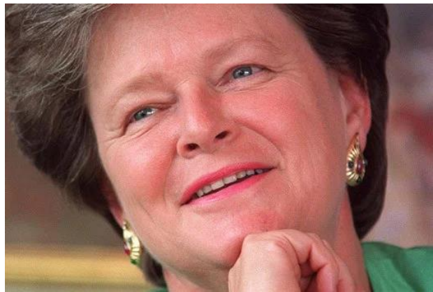
Illustrasjonsbilde 6 – Gro Harlem Brundtland

utypet i stor grad hvordan dette ble mottatt i den norske politikken, utover en setning som stikker seg fram. Det står skrevet at «den aktive og samfunnsengasjerte kvinnebevegelsen tvang partiene til å slippe kvinner inn i politiske lederstillinger og på partilistene.» 134 Det kommer fram at antall kvinner i politikken økte, men det at Gro Harlem Brundtland ble Norges første kvinnelige statsminister presenteres ikke.