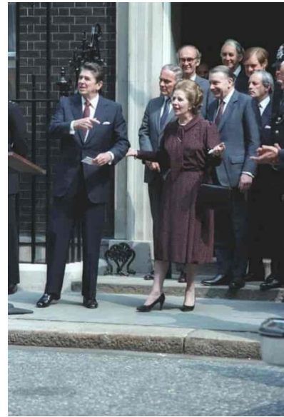
Illustrasjonsbilde 5 – Margaret Thatcher

Storbritannias tidligere statsminister, Margaret Thatcher, er en kvinne man forventer å finne i en historielære bok, spesielt i en fra 1980-tallet. På 1980-tallet var det fortsatt relativt nytt at kvinner var i ledende posisjoner i samfunnet. Det er enda ikke i dag et stort antall kvinner som har vært statsleder i et så innflytelsesrikt land som for eksempel Storbritannia. På 80-tallet var det enda færre som hadde oppnådd en slik posisjon. Derfor er det underlig at Margaret Thatcher bare blir nevnt i teksten. Det blir ikke presentert noen informasjon om henne som person, kun noen korte setninger om hennes politikk. En setning i læreboken om hennes politikk gjør derimot at en kan danne seg et lite bilde av henne som person.