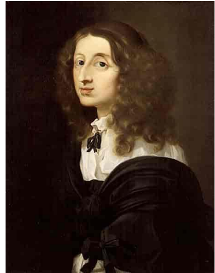
Illustrasjonsbilde 9 - Kristina Augusta (Bourdon, 1630-1660)

Dronning Kristina av Sverige blir for første gang presentert i teksten i sammenheng med sin far. « Etter trettioåriga krigets slut 1648 följde några år av fred, då Sverige styrdes av Gustav Adolfs dotter, drottning Kristina. » 155 Dette er i hovedsak den informasjonen man får om dronning Kristina gjennom hovedteksten. Det er derimot en tekstboks som dekker en hel side om henne, der man får et tydeligere bilde av denne kvinnen. Gjennom teksten får man inntrykk av dronning Kristina var en kvinne med sterke egne meninger og som ikke fulgte de daværende kjønnsrollene. Det kommer blant annet frem at hun ikke gikk i typiske kvinnelige klær, og at hun gjerne var med på jakt. Teksten beskriver henne med et nøytralt språk. Det fortelles at hun ikke ville gifte seg, og dette blir ikke diskutert nærmere eller satt spørsmål ved, samtidig som det heller ikke blir lagt stor vekt på. Gjennom denne tekstboksen kan vi få et inntrykk av en sterk og selvstendig kvinne som sto på egne ben og gjorde det hun ville. I denne læreboken er det lagt liten vekt på å beskrive kvinners stilling i samfunnet. Det blir derimot i beskrivelsen av dronning Kristina poengtert at det at hun fikk en god utdanning, var uvanlig for kvinner på denne tiden som ikke var av høy status i samfunnet. Det blir derfor tydelig at dronning Kristina ikke nødvendigvis kan brukes som et bilde på å vise hvordan kvinner generelt på 1600-tallet levde. 156