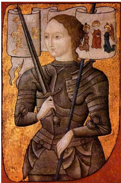
Illustrasjonsbilde 7 – Jeanne d’Arc (Anon., 1450-1500)

Jeanne d’Arc har fått en liten halvside dedikert til sin historie. 145 Gjennom teksten blir hun framstilt som en sterk kvinne som var Frankrikes redning på 1400-tallet. Teksten gir uttrykk for at dette var en kvinne som var svært viktig for Frankrikes historie og kamp mot Storbritannia, og det skrives at hun i ettertid har blitt sett på som et symbol på fedrelandskjærighet i fransk historie. 146 Konkret hva hun gjorde i de franske styrkene annet enn at «...med den unge jomfruen i spissen gikk de franske styrkene fra seier til seier.» kommer ikke fram. 147 Det er brukt mer plass i denne rubrikken på å fortelle om at Storbritannia førte rettsak mot henne og hva hennes henrettelse hadde å si for den franske nasjonalfølelsen, enn å beskrive henne som person og hva hun utrettet. Språket som beskriver henne, kan