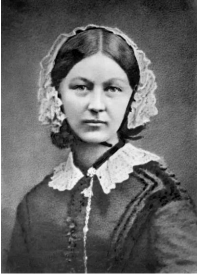
Illustrasjonsbilde 4 – Florence Nightingale

Florence Nightingale blir presentert i sammenheng med Krimkrigen. « Florence Nightingale kastet seg med glød inn i arbeidet for de syke og sårede ». 87 Det poengteres at det inntrykket som soldatene gjerne dannet seg av henne gjennom brev de skrev hjem, var et romantisert bilde som ikke stemte. « Florence Nightingale var en enestående effektiv og autoritær organisator. (...) I stadig kamp med legene og de militære myndighetene ordnet hun opp. De var livredde for hennes temperamentsutbrudd og sarkasme. Med utrettelig slit greidde hun å presse dødeligheten på lasarettene ned fra 42% til 2%. »