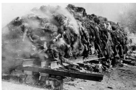
Bilde: 12 Skjermdump "Vitnessbyrd fra overlevende av terrorbombingen av Dresden"

I historien " Vitnessbyrd fra overlevende av terrorbombingen av Dresden " bruker Nordfront to bilder; et åstedsbilde og et øyeblikksbilde.