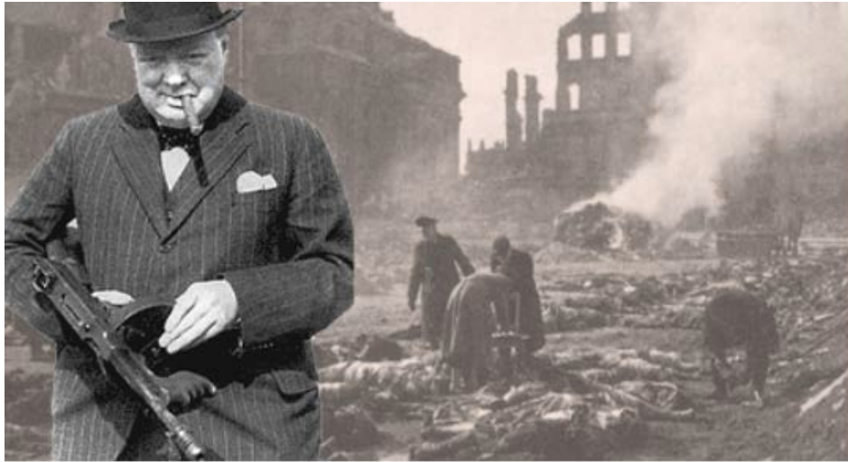
Bilde: 13 Skjermdump "Vitnesbyrd fra overlevende av terrorbombingen av Dresden"

På et symbolsk plan skal bilde vise til det enorme antallet uskyldige mennesker som omkom under bombeangrepet.