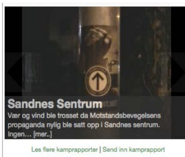
Bilde: 10 Nordfronts hovedside – Skjermdump

Øverst i kolonnen er en interaktiv bildeserie som viser ulike aksjoner og demonstrasjoner utført av Nordfront rundt omkring i Norge. Bildeserien viser gjennomsnittlig fem bilder som pulserer med 10 sekunders mellomrom. Nordfront har gjort det mulig for leserne å sende inn ”kamppapporter”, og få bildene sine publisert og synliggjort for andre medlemmer.