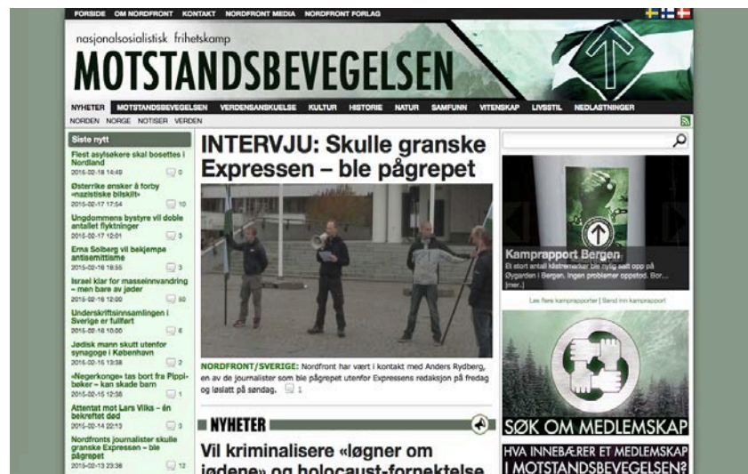
Bilde: 8 Nordfronts hovedside - Skjermdump

I motsetning til Vigrid, er Nordfront en langt mer omfattende organisasjon, noe som også gjenspeiles i uttrykket på hjemmesiden. Fargevalg, logo, bilder og skift, kombinert med en oversiktlig layout gjør at nettsiden fremstår som seriøs og lett å finne frem