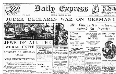
Bilde: 2 ”Jødedommen erklærer Krig mot Tyskland”. Skjermdump.

Historien ” Jødedommen erklærer Krig mot Tyskland ” er illustrert med tre bilder hvorav ingen er satt i sammen med en tilhørende bildetekst. Bildene er tilsynelatende så visuelt sterke og beskrivende i den konteksten de står, at det kan virke som at Vigrid unnlot bildeteksten nettopp av denne grunn. 253