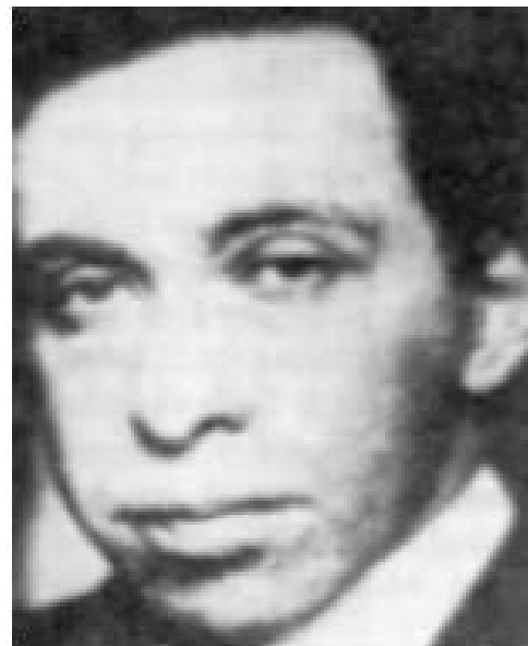
Bilde: 4 "Jødedommen erklærer Krig mot Tyskland." Skjermdump.

Bildene brukt i ” Jødedommen erklærer Krig mot Tyskland ” fremstår som sterke visuelle virkemidler, ment for å appellere til leserens følelser og dermed også konnotative assosiasjoner. Bildene, kombinert med de tekstuelle virkemidlene innad i historien, bidrar til å styre leseren mot forfatterens intenderte budskap.