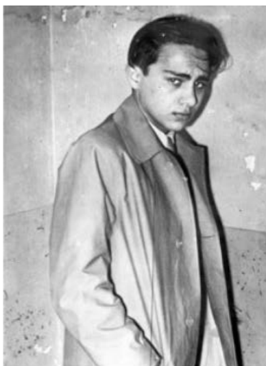
Bilde: 11 Skjermdump "Krystallnatten"

I likhet med Vigrid, har Nordfront valgt å sette enkelte bilder opp mot hverandre. Dette kommer spesielt frem i portrettene. Som nevnt i den lukkede fortellingen dømmer ikke forfatteren, men han lokker sine tilhørere til det. Måten portrettene er satt sammen vitner om en slik