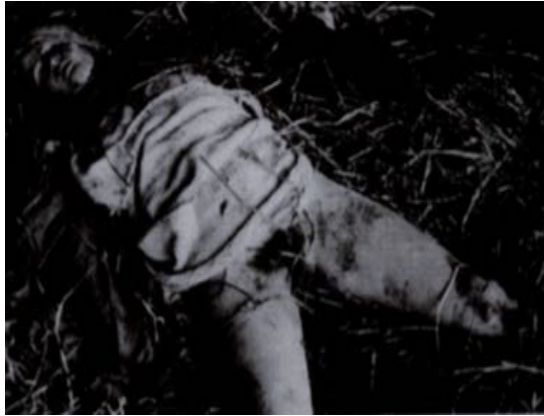
Bilde: 3 "Jødedommen erklærer Krig mot Tyskland". Skjermdump.

Det andre bildet, er et åstedsbilde av en voldtatt og drept ung jente. Bildet er i svart hvitt, hvor jenta i ført lyse klær står i kontrast til den ellers mørke bakgrunnen. På et symbolsk plan fremstår den hvitkledde unge jenta som et symbol på uskyld og renhet; i sterk kontrast til mørket rundt henne. Samtidig kan symbolikken i bildet på mange måter ligge i hva bildet ikke viser. 256