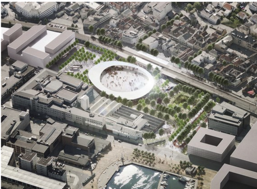
Figur: Fugleperspektiv av vinnerbidraget «Lysningen» (Hennissen, 2012)

I en pressemelding uttalte Space Group og Super union: