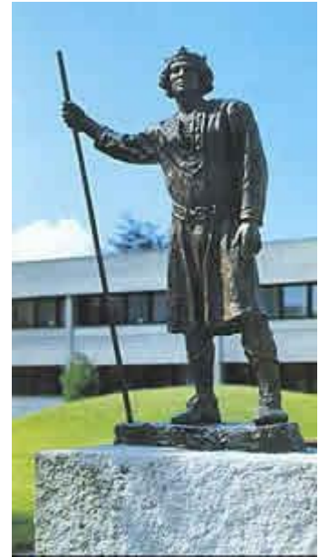
Figur 1. monument av Magnus Erlingsson, Etne kommune