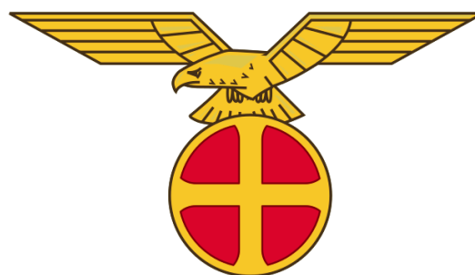
Figur 3. Solkorset (Olavskorset) med solørn. Store Norske Leksikon.

Norrøne symboler ble tatt i bruk i den nazistiske propagandaen. Mest kjent er kanskje solkorset, eller olavskorset, som vi ser i figur 3 som ble tatt i bruk av Nasjonal Samling i Norge under okkupasjonen. Denne symbolbruken inspirert av norrøn mytologi, gjorde at det norrøne nå ble blandet sammen med Nazi-Tysklands inhumane gjerninger.