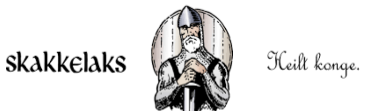
Figur 2: Slagord "Skakkelaks.no". Godt lokalt.

trykke deg inn på. Figur 2 viser hvordan nettsidens øvre del ser ut. Mellom teksten brukes det et bilde av en mann med hjelm, ringbrynje og et sverd. Ut ifra et slagord som også brukes og vil analyseres senere,