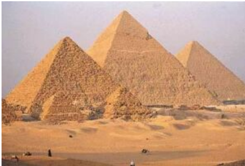
Figur 2 Pyramidene i Giza. Kulisser for "Peer Gynt"