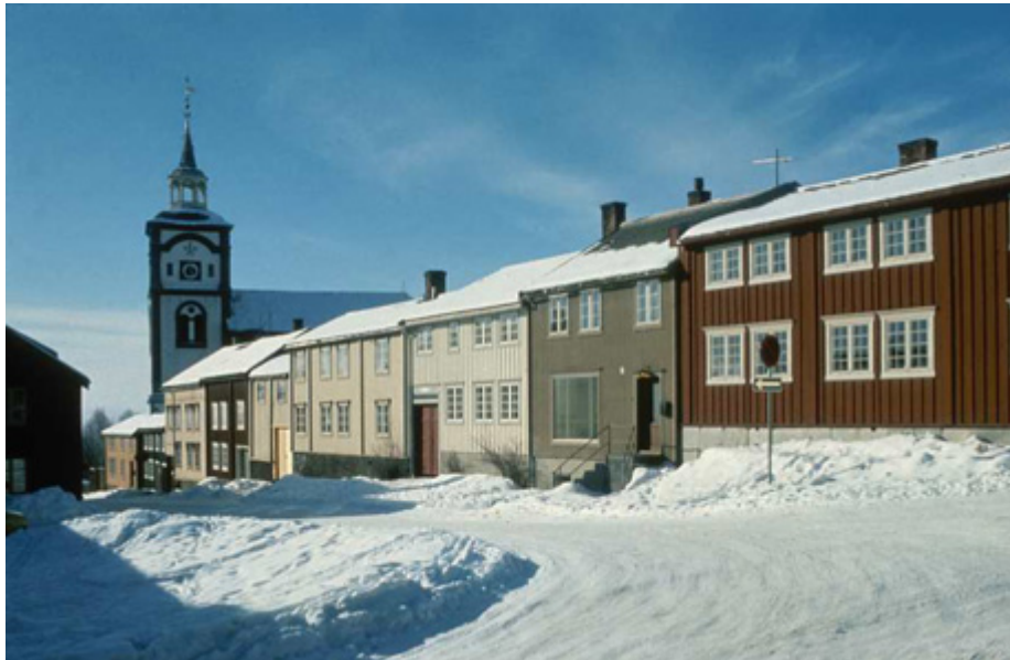
Figur nr 3

fikk verdensarvstatus var Bryggen i Bergen og Urnes stavkirke (1979). Året etter ble Bergstaden Røros(1980) oppført på listen, og til slutt helleristningene i Alta (1985). Det skulle gå 23 år til neste nominering. Da begynte en utvikling i prioriteringer fra kulturområder til naturlandskaper. Vegaøyene var først (2004) og senere vestnorske fjordlandskap som er de første naturområder Norge har fremmet for UNESCO, Geirangerfjorden og Nærøyfjorden (2005) ( http://www.unesco.no ).