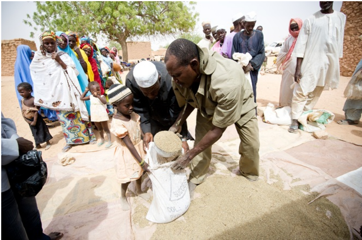
Matvaredistribusjon i Niger

Styrker internasjonal humanitær mathjelp lokale kapasiteter