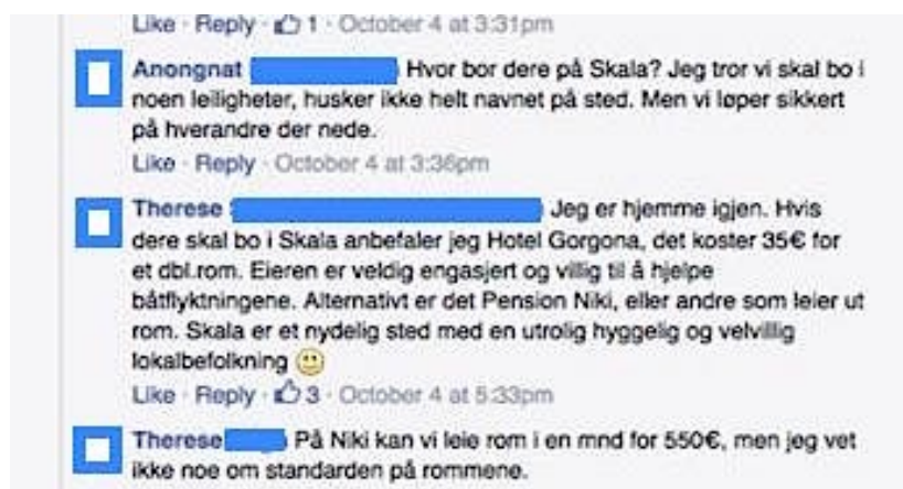
Figur 6: Dialog i facebookgruppen Dråpen i Havet 4. oktober

Å få umiddelbar tilbakemelding på et initiativ eller spørsmål, er viktig for frivillige i de selvorganiserte gruppene. Flere av informantene sier at etter at beslutningen om å dra er tatt, bestilles flybilletter og hotell umiddelbart. De selvorganiserte gruppene bruker sosiale medier til å dele erfaringer, svare på hverandres spørsmål, hjelpe til med organisering av reiser etc.