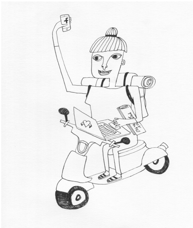
Illustrasjon: Marte Isachsen Knudsen