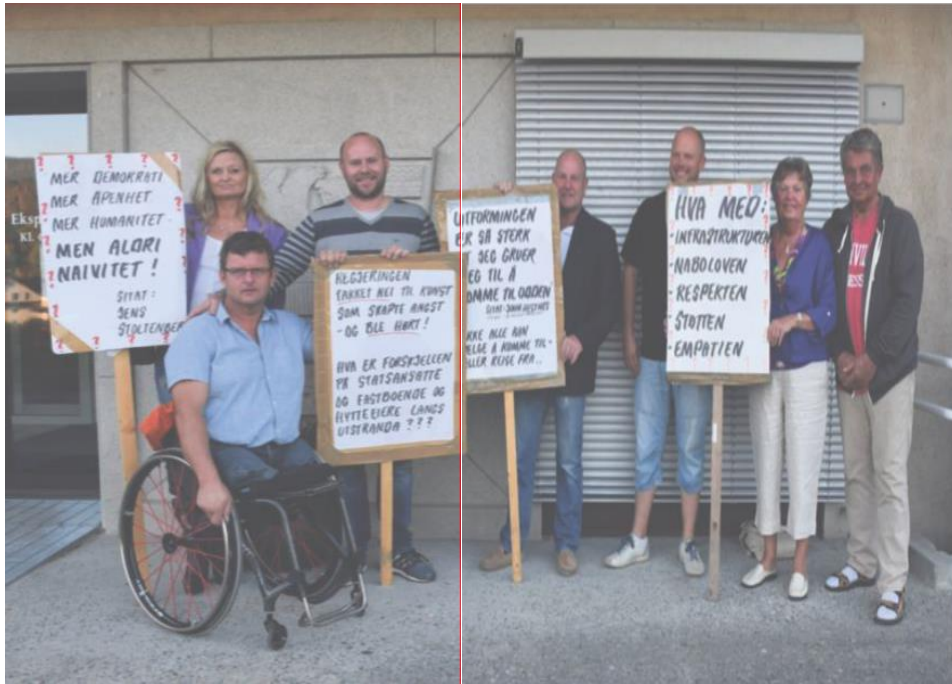
Fig 4: Noen av naboene som protesterer mot minnstedet. ("Naboprotest," 2014)