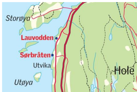
Fig 1: kart over det aktuelle området for minnstedet ("Lauvodden og Sørbråten er alternativer for minnsteder etter 22. juli.," 2013)

grunn da det ble bestemt at minnstedet skulle legges til Sørbråten, en odde lokalisert på fastlandet like nord for Utøya.