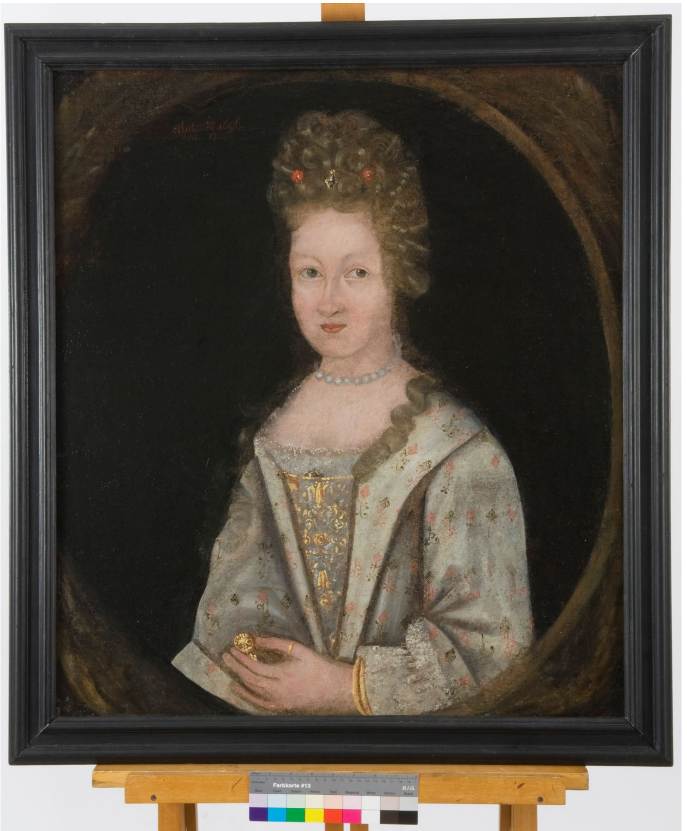
Fig. 2: Maleriet etter behandling