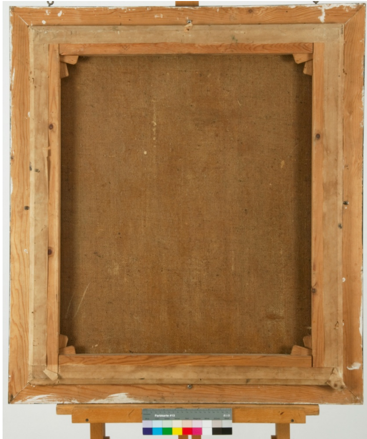
Fig.3: Maleriets bakside før behandling