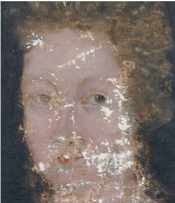
Fig. 16: Detalj av ansikt etter kitting