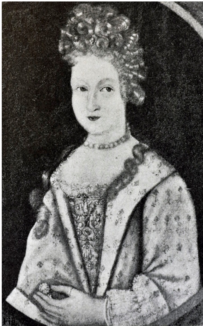
Fig 7: Fotografi fra 1920