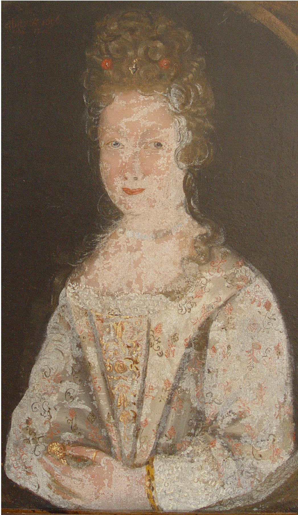
Fig. 5: Figuren før behandling uten forsidesikring