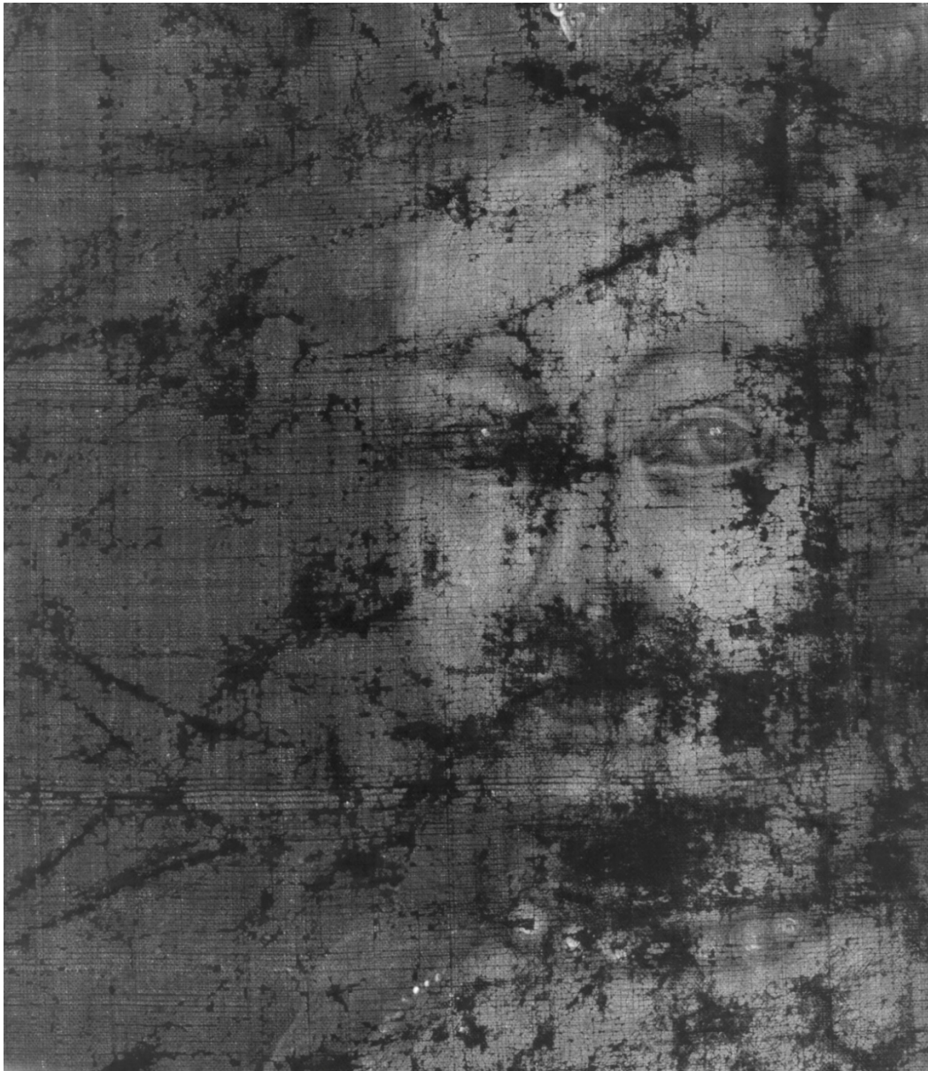
Fig. 8: Røntgenfotografi av ansiktet