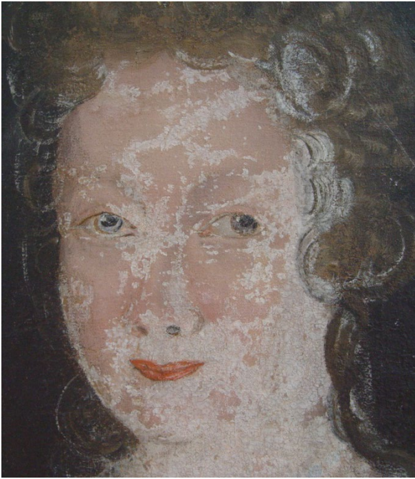
Fig. 14: Detalj av ansiktet før behandling