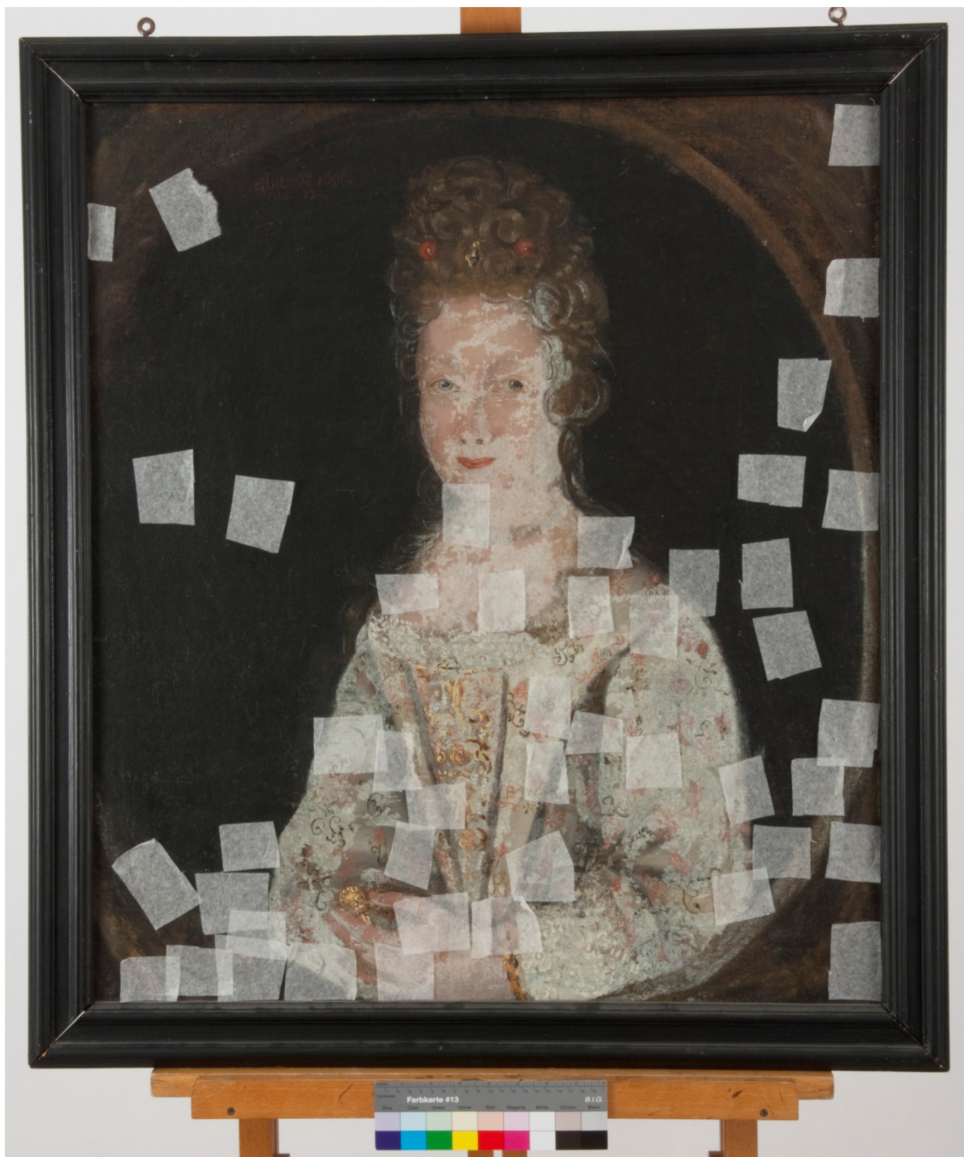
Fig. 1: Maleriet før behandling