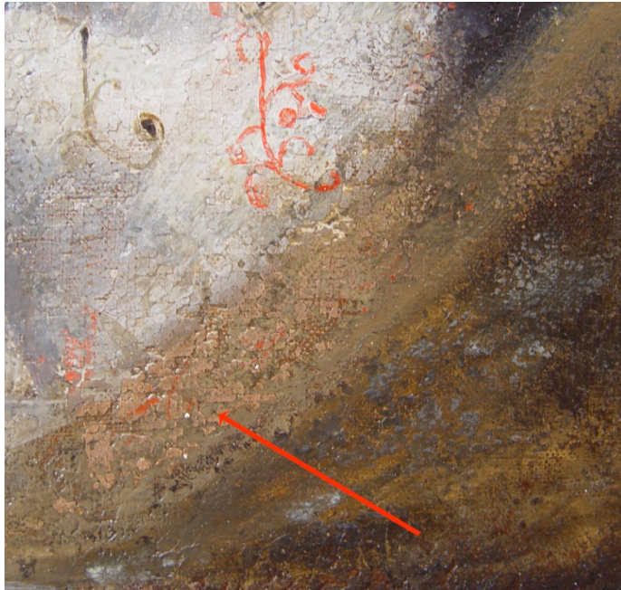
Fig. 6: Spor etter signatur, nedre høyre hjørnet