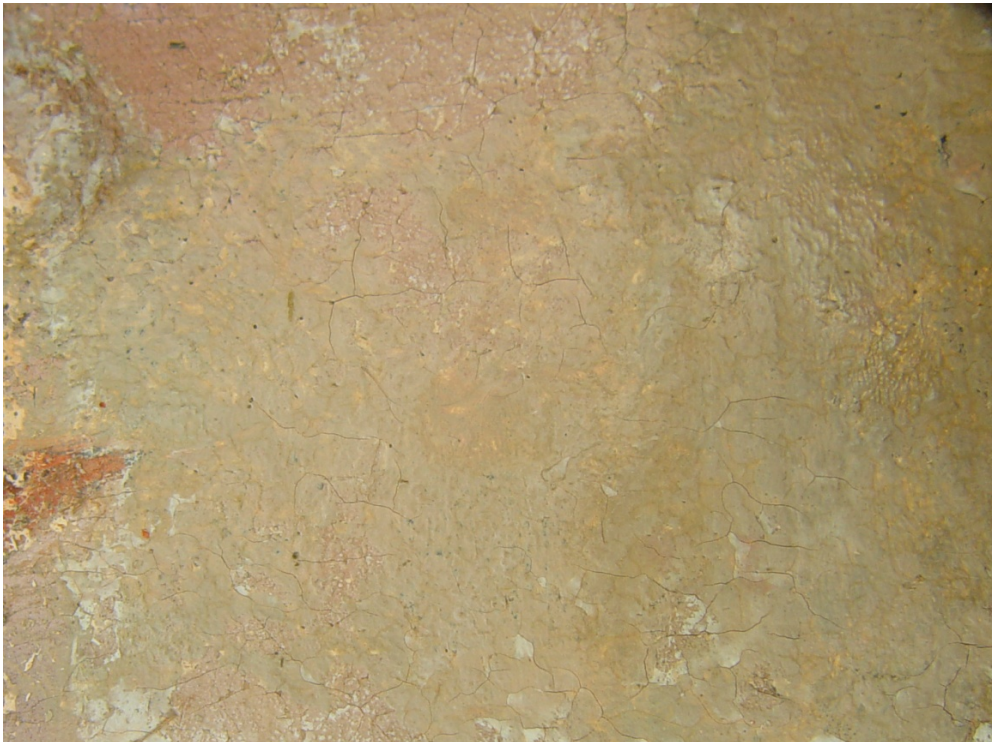
Fig. 11: Oppbrutte retusjeringer i figurens venstre ansiktsdel mettet med etanol