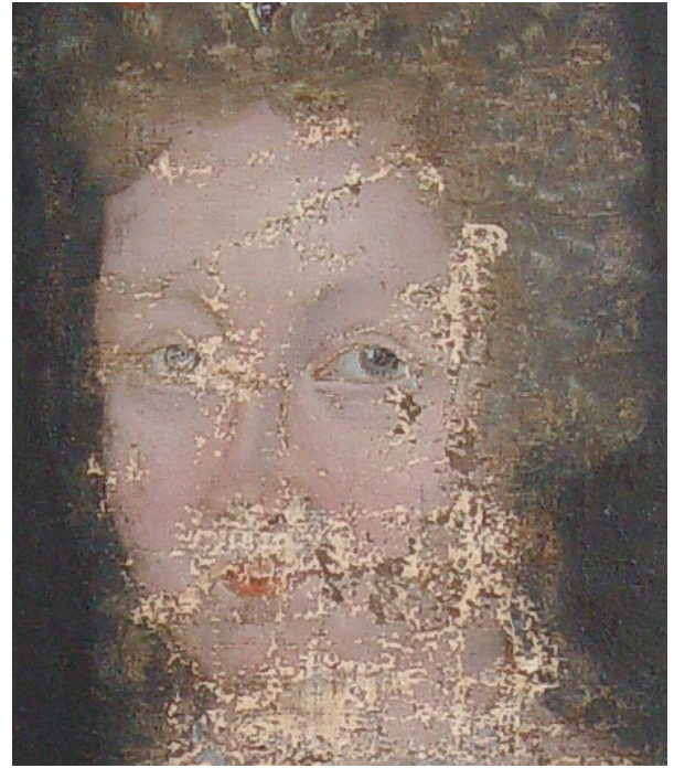
Fig. 15: Detalj av ansikt etter fjerning av overmaling og retusjer