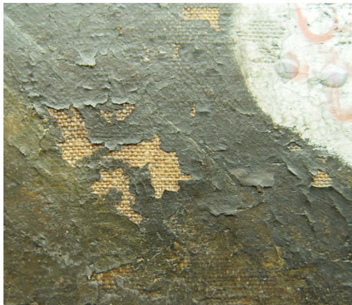
Fig. 9: Detalj av oppskallinger (ved figurens høyre albue)