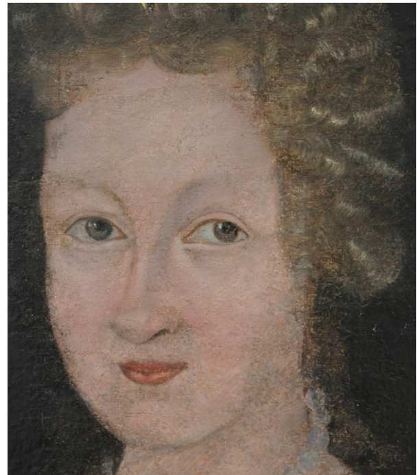
Fig. 17: Detalj av ansikt etter retusjering