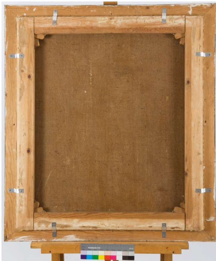
Fig. 4: Maleriets bakside etter behandling