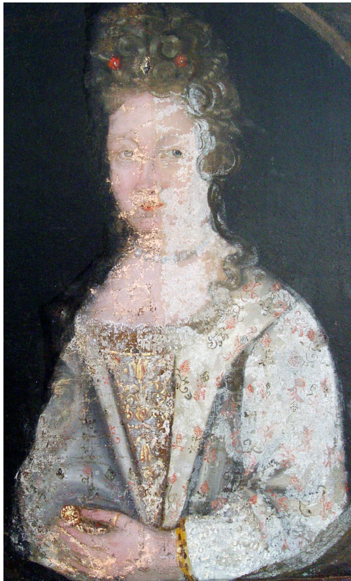
Fig. 12: Figuren delvis renset