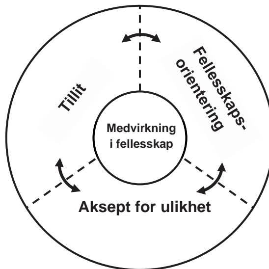
Figur 2 – Sammenfattende vilkår for medvirkning i fellesskap

fellesskap uten en fellesskapsorientering, og likeledes uten tillit til hverandre eller en viss aksept for ulikheter.