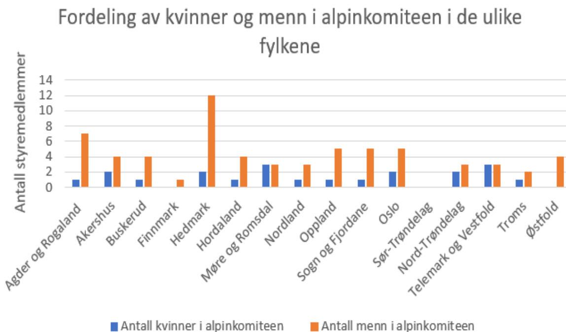
Figur 2: Kjønnsmessig fordeling i alpinksportene i fylkene (Norges skiforbund, 2021)

NIF (Norges Idrettsforbund) har en strategi for å oppnå likestilling og likeverd mellom kvinner og menn i alt idrettsarbeid. NIF vil oppnå en større kjønnsbalanse i lederskap på alle nivåer i idretten. (Fasting & S. Sand, 2017b, s. 4) De vil integrere kvinner på alle områder i organisasjonen i arbeidet med idrett. Det er ingen hemmelighet at det i dagens samfunn er et mindretall av kvinner i styrer generelt. (Hodven, 2011a, s. 299) I for eksempel alpinksportene kan vi se ulikhetene mellom menn og kvinner, der styrene i høy grad er preget av flest menn.