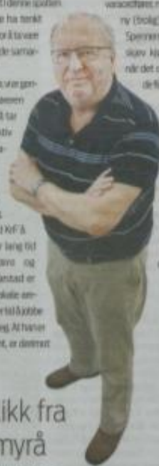
Falkeblikk fra Flassamyra av Ole Svertsen

Sperrende ram vekst skav kjøringsleding når det også er men i de fleste andre utfordringene. Jeg mener det bør gi pluss til en sterk og vakk kvinne etter at Olavug Bøllestad har forsvunnet til nye arenaer.