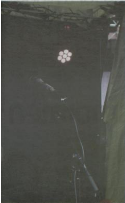
kan fortsette med det fra hesten av, er fortsatt uklart.