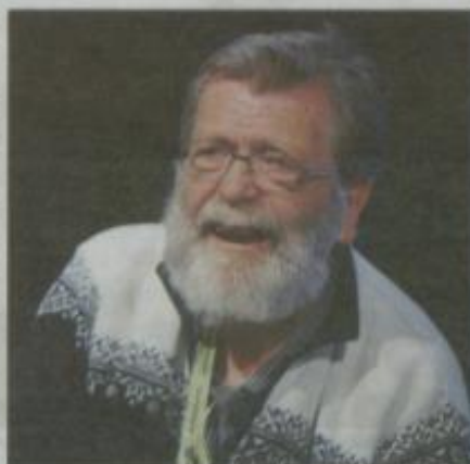
Partiene har ingen ordentlig avtale; den er bare moralsk bindende, sier Frank Aarebrot.