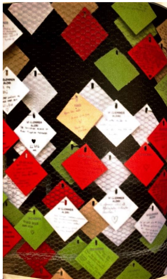
Bilde 1: «Hønsenettingen fra Utøya» 72

På mange måter illustrerer dette på en god måte hvordan det kommunikative minnet kommer til uttrykk på vidt forskjellige måter. På samme måte illustrerer det kompleksiteten, og utfordringen, i å skape et felles, kulturelt minne. Kortene på hønsenettingen utgjorde i så måte et konkret symbol på utfordringen som lå foran AUF; de ulike fortellingene, behovene og sterke ønskene som måtte forenes i ett felles kulturellt minne om 22.juli-terroren.