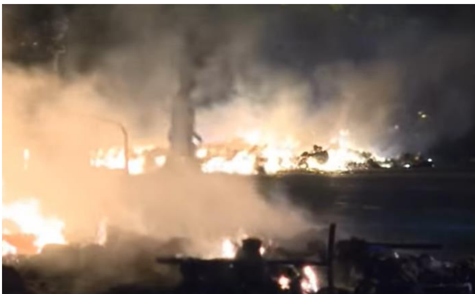
Figur 3: SIAN sitt eksempel på muslimsk ødeleggelse 106

Tekst 6 fortsetter å fokusere på kategori 2 for å argumentere for SIAN sitt anti-islamske innhold. Artikkelen tar for seg hvordan Islam kan fremstå som en venn, selv om de egentlig er en fiende. Igjen legges det som sagt stor vekt på historiske hendelser knyttet til Islam. Hoved påstanden handler om at mange blir lurt inn i en falsk trygghet knyttet til Islam og artikkelen presenterer argumenter for hvorfor dette ikke stemmer. 107 Dette igjen er jo et klassisk trekk i antisemittismen, hvor minoriteters egentlige motiver blir skjult bak en fasade.