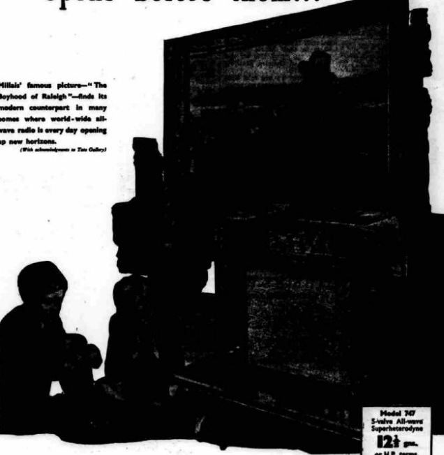
Hillier's famous picture—"The Boyhood of Raleigh"—finds its modern counterpart in many homes where world-wide all-wave radio is every day opening up new horizons.