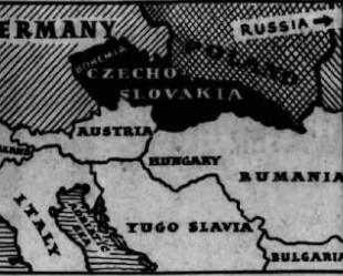
The strained relations which have existed with Germany have been eased recently

No doubt, there have been instances where the allotment of State contracts to Czech firms employing Czech labour imported from other districts, instead of employing