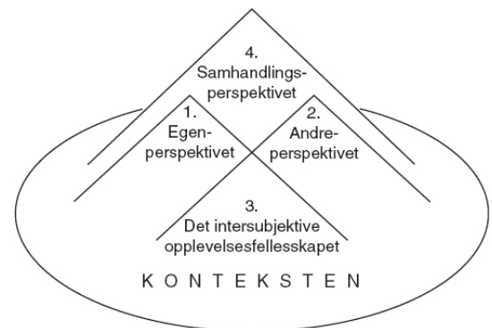
Figur 2.3.1 Fire-perspektivs modellen for kommunikasjon (Røkenes mfl., 2012).

Røkenes & Hanssen (2012) viser til fire-perspektivs modellen. Den innebærer fire grunnleggende perspektiver som kommunikasjon oppleves fra i samhandlingen mellom mennesker. Modellen bygges ut ifra en intersubjektiv tenkning, fenomenologi, hermeneutikk og systemisk relasjonstenkning (Røkenes & Hanssen, 2012, s. 39). Modellen går ut på å ha forståelse for menneskers ulike perspektiver, og samtidig ha forståelse for seg selv i kommunikasjonen.