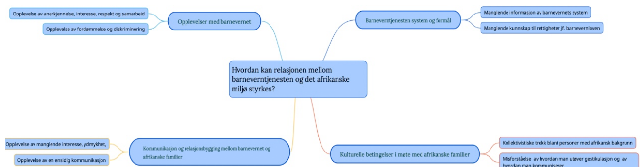
Figur. 3.5 Visuell representasjon over tema

Ifølge Braun & Clarke (2006) starter fase 3 når all data er kodet, og informasjonen fra informantene er blitt analysert. Det innebærer å sortere de ulike kodene, inn i relevante temaer på et dypere nivå. Forfatterne hevder at det kan være nyttig å bruke visuelle representasjoner, slik at det blir lettere å sortere kodene i temaer (Braun & Clarke, 2006, s. 19, egen oversettelse). I intervjuguiden delte jeg spørsmålene inn i de undernevnte hovedtemaene. Videre ble hovedtemaene inndelt i ni undertemaer. For å kunne sortere de forskjellige kodene og utsagn inn i tema, har jeg valgt å bruke tabell og post-it lapper som en visuell representasjon.