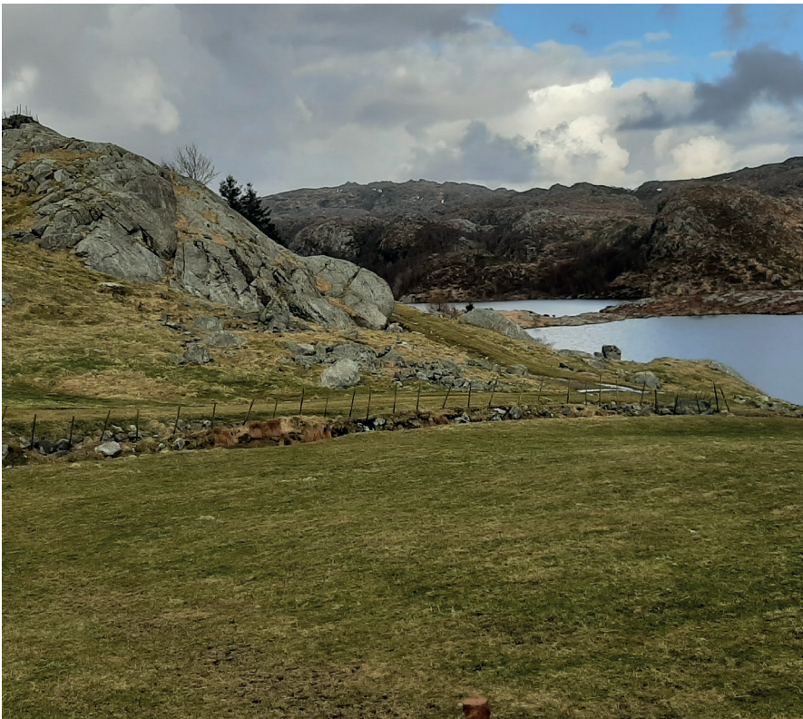
Fig. 2. Frå gardsbruket Snorestad (uttala / ʰ snå:rest/) og Snorestadtjørnane på matrikkelgarden Skorland (Time). Føreleddet i namnet Snorestad er truleg gno. snara f. ‘snare’, gno. * Snørustaðir , med bakgrunn i fuglefangst med snarer. I og med at føreleddet opphavleg har hatt to stavingar, har a -en i sisteleddet falle bort i den nedarva lokaluttalen.

vandringstida. Lindanger (loc. cit.) tolkar namnet som ‘Fredriks stad’, med andre ord som samansett med mannsnamnet gno. Friðrekr (dvs. Fredrik ). Dette personnamnet har ein rekna med i matrikkelgardsnamnet Friestad , som førekjem to stader på Jæren, nemleg i Klepp og Hå. I den nedarva lokale uttalen av namnet Friestad , som er / ʰ fri:est/, har a -en i etterleddet falle, i samsvar med regelen om at staðir -namn på Jæren med føreledd på opphavleg to eller fleire stavingar får a -bortfall i etterleddet. Sidan uttalen av namnet frå Stora Undheim er / ʰ freista/, synest ikkje tolkinga til dette mannsnamnet, gno. * Friðreksstaðir , vera rimeleg. Ein skulle i så fall ha venta bortfall av a -en i sisteleddet. Opphavet til namnet Freistad må seiast å vera uvisst. Ein kunne kanskje tenkja seg at føreleddet har samanheng med verbet freista (* Freist- ) med real bakgrunn i store utfordringar med rydding av denne garden, som ligg i eit