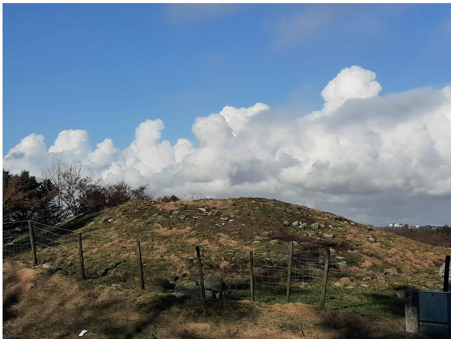
Fig. 3. Den store gravhaugen Nyvlesthøyen på gardsbruket Nyvlest ( Nyvlestad ) på matrikkelgarden Sør-Varhaug (Hå) er ca. 25 m i diameter. Nyvlest er eit gammalt øydegardsnamn på -stad . På denne staden finn ein også særst lange hustuffer frå eldre jernalder, den lengste på ca. 75 m.

ifølgje Reiersen (op. cit. s. 163) har meir enn dobbelt så mange langhus (hus på meir enn 40 m) frå denne perioden som resten av landet (Noreg). På tre av stadene, bl.a. på Nyvlest , finn ein hus på over 70 m, alle desse tre stadene ligg i noverande Hå kommune, nemleg i dei tidlegare herada Varhaug og Nærbø. I og med at namnet Nyvlest er så tett knytt til øydegardstuffer frå eldre jernalder og ein stor gravhaug, synest det rimeleg å rekna dette som eit busetnadsnamn frå førhistorisk tid av stad -klassen, kanskje frå sein romersk jernalder eller folkevandringstida.