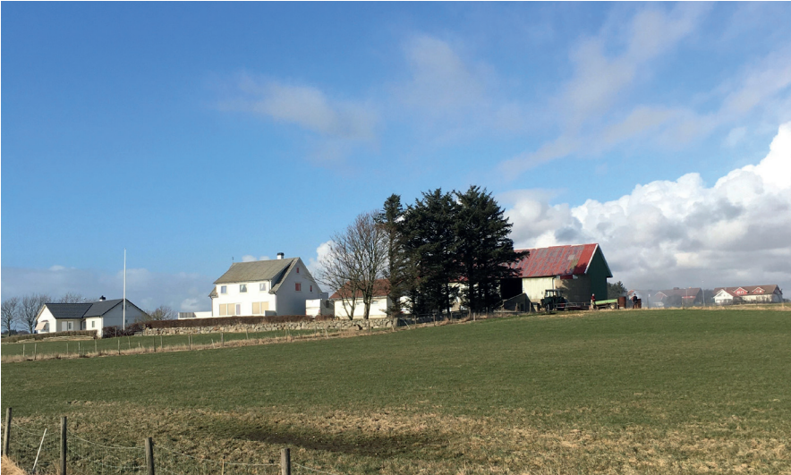
Fig. 4. Gardsbruket Ævestvollen under Sør-Varhaug (Hå). Som føreledd i dette namnet finn ein truleg eit gammalt øydegardsnamn på -stad , * Ævestad , med uttalen /'æ:vest/ i jærdialekten. Namnet Ævestad /'æ:vest/ finst også som namn på ein matrikelgard i Hå.