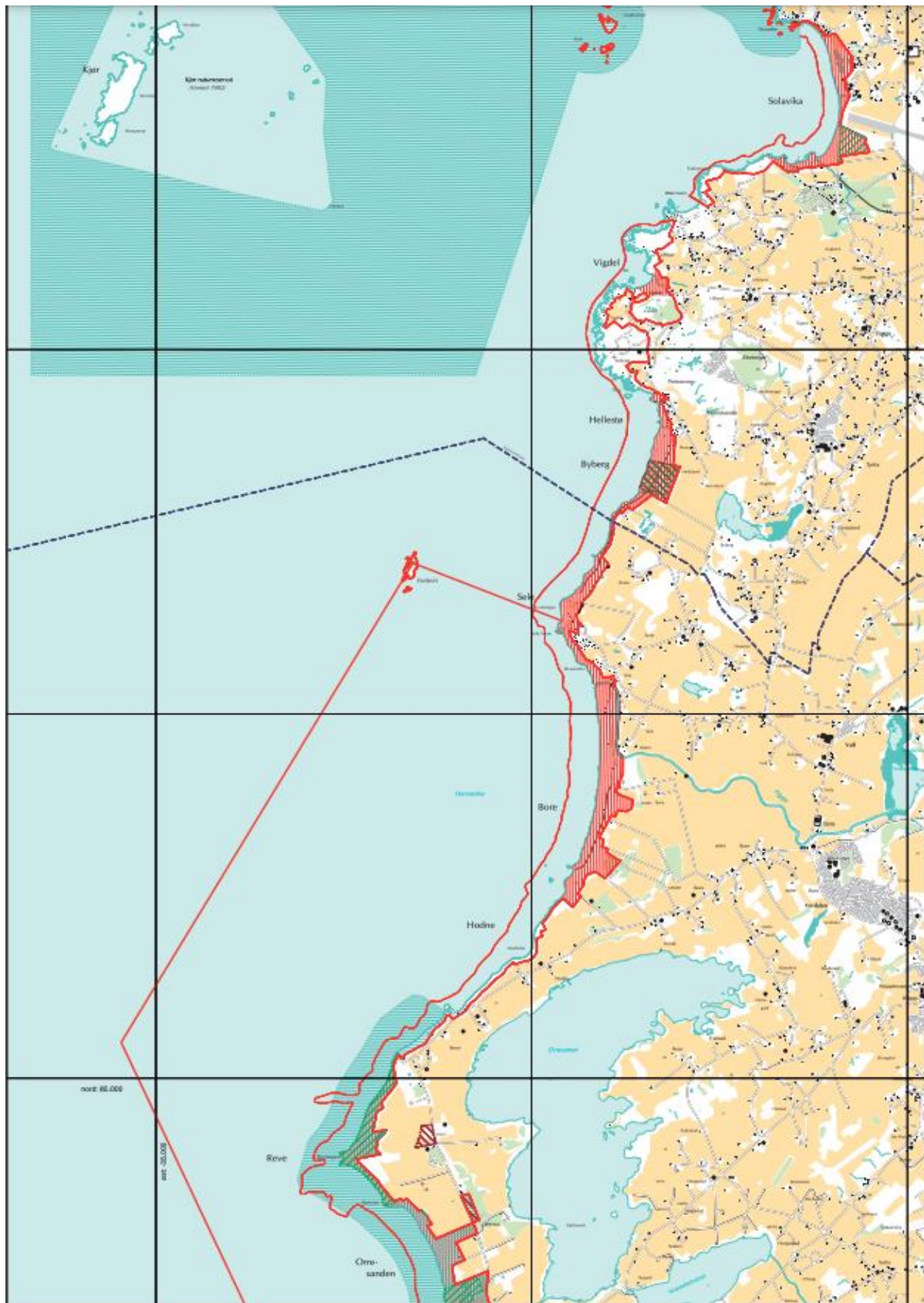
Figur 1.2 Kart over strekningen Solavika til Orresanden