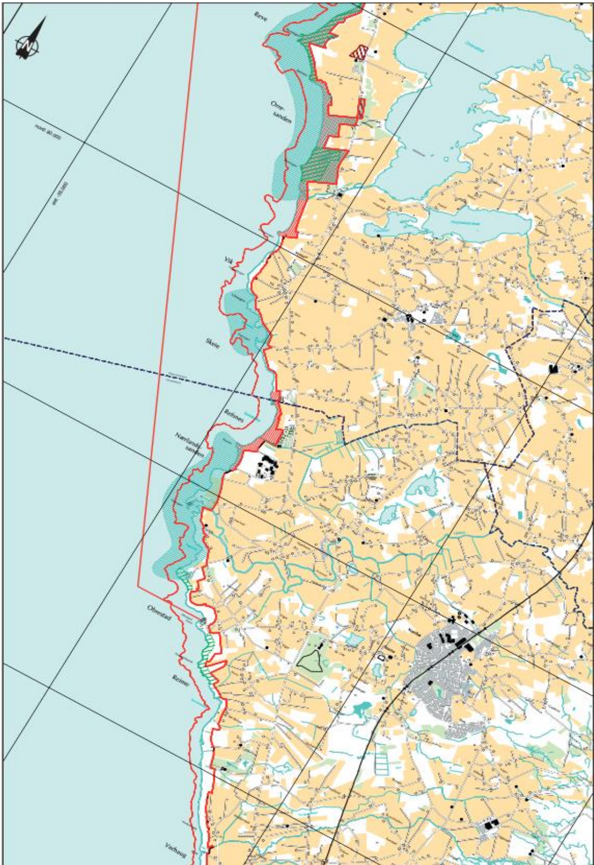
Figur 1.3 Kart over strekningen Orresanden til Varhaug