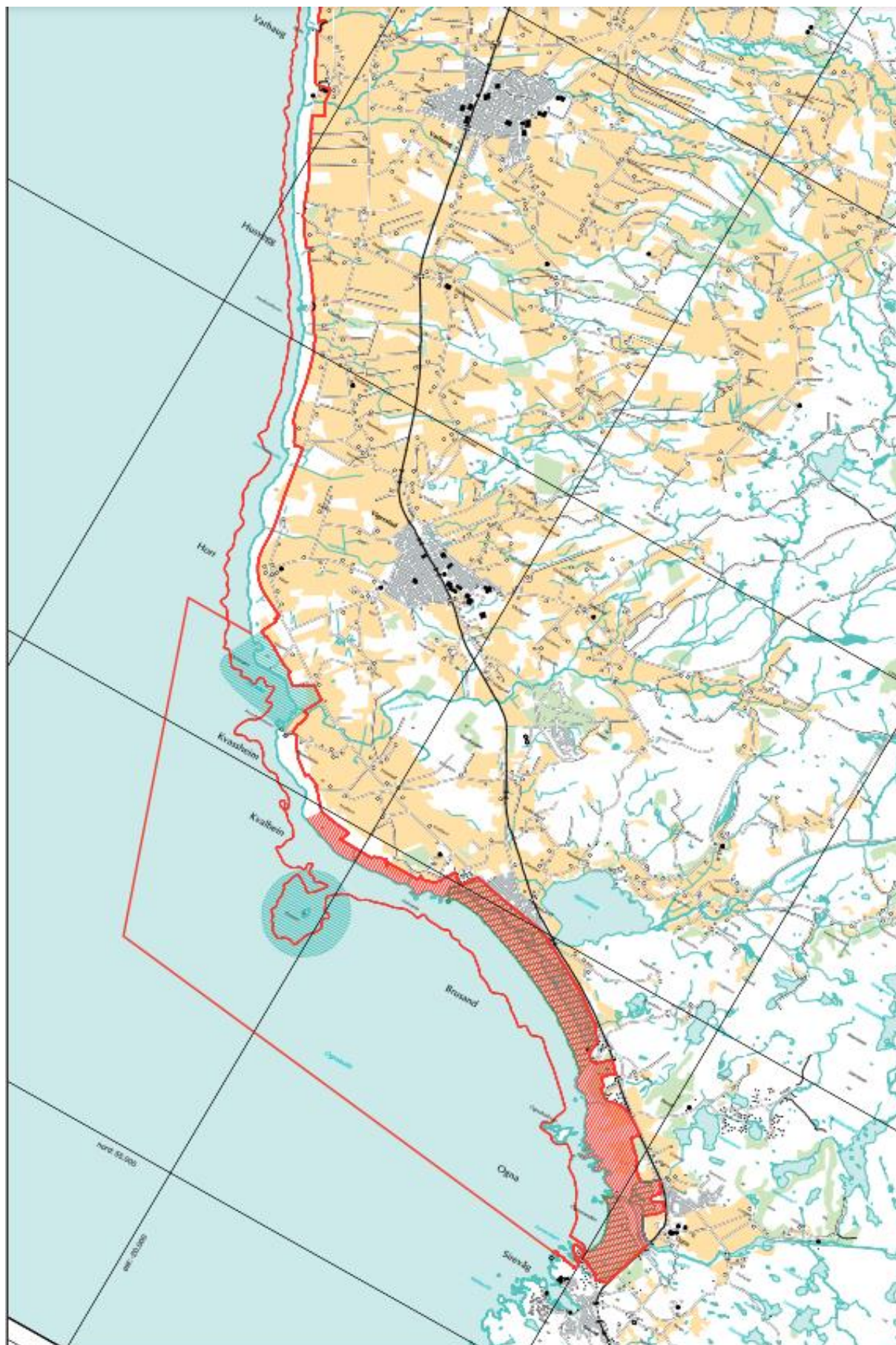
Figur 1.4 Kart over strekningen Varhaug til Ognå