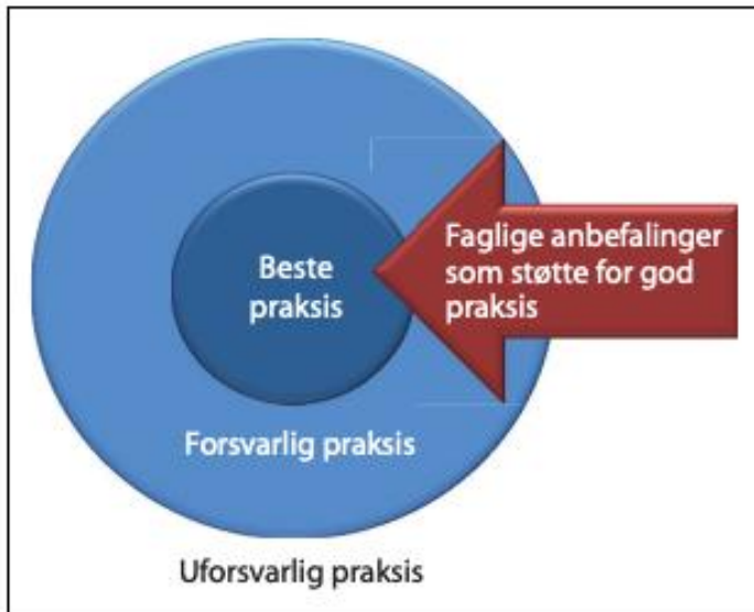
Figur 1: Faglige anbefalinger som støtte for beste praksis