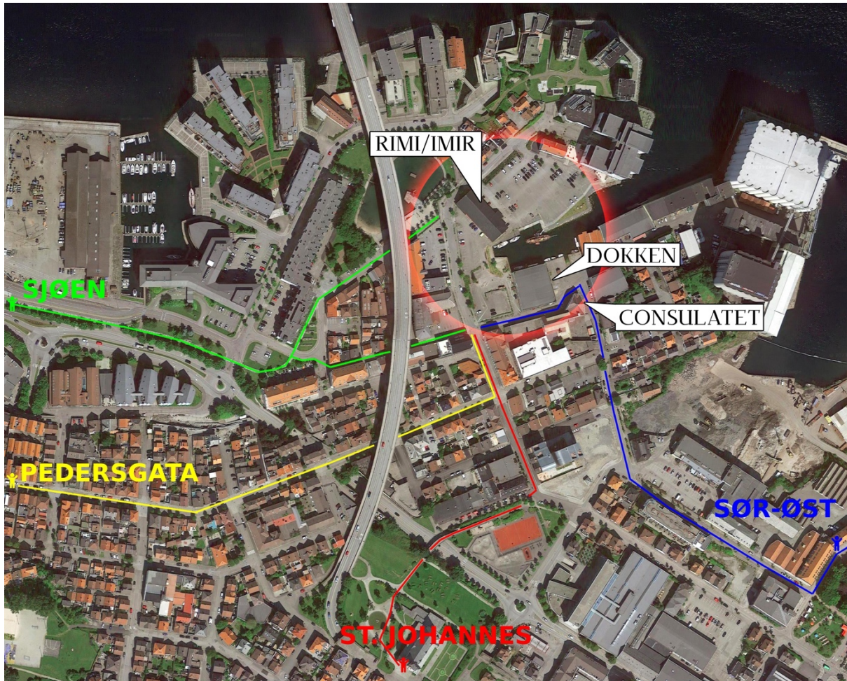
Fig 3. Fire ruter til Svankevigå (Google maps, egen illustrasjon)

Starter man i området rundt St. Johannes går man rett på en stor, ny boligblokk akkompagnert av en av Stavangers mest populære lekeplasser. I Harald Hårfagres gate ned mot Svankevigå finnes antikkforretning, en interesseorganisasjon, og et religiøst kultursenter.