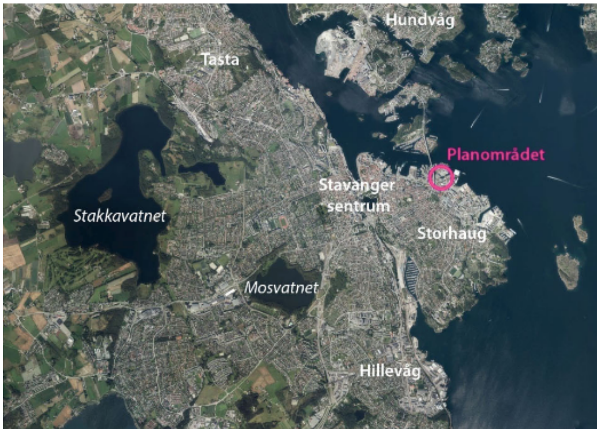
Fig 2. Geografisk plassering av Svankevigå (Stav Arkitekter AS, 2020)

Det er mange måter å komme seg til Svankevigå avhengig av hvor man starter. Til fots har jeg brukt fire forskjellige ruter: