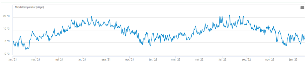
Figur 3: Temperatur over tid

For å kunne undersøke endringer i forbruk fra år til år har vi brukt historiske værdata fra Meteorologisk institutt (2023) for å se om strømforbruket har endret seg i takt med temperaturene. Meteorologisk institutt (2017) er en statlig kilde som er ansvarlig for blant annet værdata og formidling av denne dataen. Her har vi hentet et datasett med gjennomsnittstemperatur per dag for Sørvest-Norge for perioden 01.01.2021 til og med 31.01.2023. Følgende figur ble også hentet fra Meteorologisk institutt (2023):