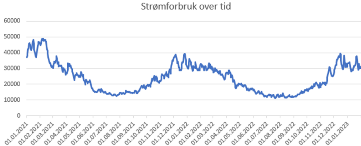
Figur 1: Strømforbruk over tid

Her er en graf av tallene vi har hentet fra Elhub som viser strømforbruk i MWh over en periode fra 01.01.2021 - 31.01.2023. Elhub er eid av Statnett SF (Proff, u.å.), som er en statlig organisasjon som har ansvaret for energisystemet i Norge (Statnett, u.å.-a). Grafen viser klare trender i forbruk gjennom årene, hvor forbruket øker på vinteren og synker på sommeren.