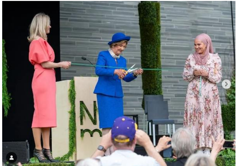
Figur 2 Dronning Sonja, Iman Meskini og direktøren åpner nasjonalmuseet 2022

Det er også mulig å posere for et bilde, og bildet vil derfor ikke vise hele sannheten. Det å posere vil derfor ikke ha en ekte virkelighetsoppfatning ettersom det egentlig ikke er ekte. De poserer for kameraet og lager en egen sannhet 18 . Som nevnt tidligere, når vi ser på bildet til Iman, så kan vi se at kameraet er moderne og kan derfor ta frys bilder uten å måtte posere 19 . Det kan derfor argumenteres for at bildet viser sannheten og virker naturlig. Vi ser de uperfekte sidene av bildet ved å se på de forskjellige smilene som ikke er synkronisert, direktøren som ikke er snudd mot kameraet, og dronning Sonja som konsentrerer seg med å kutte båndet 20 . Bildet til Iman er et typisk «gatefotografi», og det er på grunn av fotografens ønske om å ta bilde av livet som det virkelig er 21 . Iman kan være et eksempel på en muslim som er et bindeledd for andre muslimer, for å tørre å utforske den norske kulturen. Samtidig så ser vi dronning Sonja som et bindeledd for det norske samfunnet til å utforske andre kulturer.