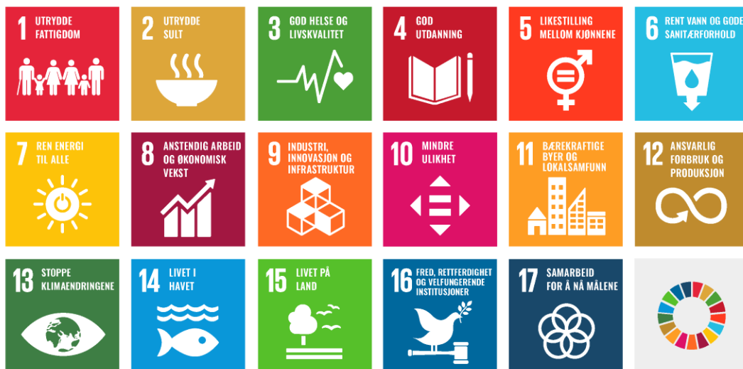
Figur 2. FNs Bærekraftsmål, 2014. ( https://www.norad.no/om-bistand/dette-er-fns-barekraftsmal/barekraftsmalene/ )

En annen måte å kunne tenke på et dilemma som en destinasjon som kanskje ikke bør være tilgjengelig for turismen er å se for seg om det som blir gjort er det rette for de som er relatert til destinasjonen. En destinasjon som SeaWorld er en verdenskjent og populær attraksjon, men den er ikke etisk på den måten av at hvis du reiser og betaler penger for å se på dette, da kan du være med å bidra til at denne destinasjonen og andre like kan utvikles og ha enda større påvirkning på dyrene og naturen, men en skikkelig etisk retningslinje som ville vært med i utviklingen av destinasjonen, ville gjort at en slik destinasjon ikke fins (Hackett, 2016). Etikk i turismen sier at vi må behandle alle likt, og jobbe mot utviklingen av noe som ikke er rett i stedet for å være en tilskuer og ikke bidra med å jobbe mot det. Siden etikken i turismen går veldig mye ut på ethvert individ og deres egne meninger og tolkninger av hva som er rett eller galt, så vil det være krevende å få alle med på ett lag og jobbe sammen for å oppnå ett enkelt mål. Etikk er ikke nødvendigvis et universalt språk som alle nasjoner og