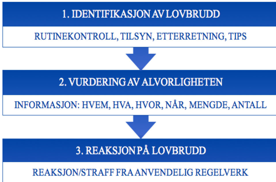
Figur 4: Håndhevelsesprosessen Laget av Eikenes og Hafstøl, basert på International Atomic Energy Agency, 2022. s. 79-90.

Den første fasen i prosessen er identifikasjonen av et lovbrudd. Ved å føre tilsyn eller rutinekontroll vil lovbrudd kunne oppdages. En lovoverstredelse kan også avdekkes basert på innsamlet informasjon, ved eksempelvis etterforskning eller etterretning. Tips fra publikum, tredjepart eller fra organisasjonen selv kan også bidra til at et lovbrudd blir oppdaget (International Atomic Energy Agency, 2022).