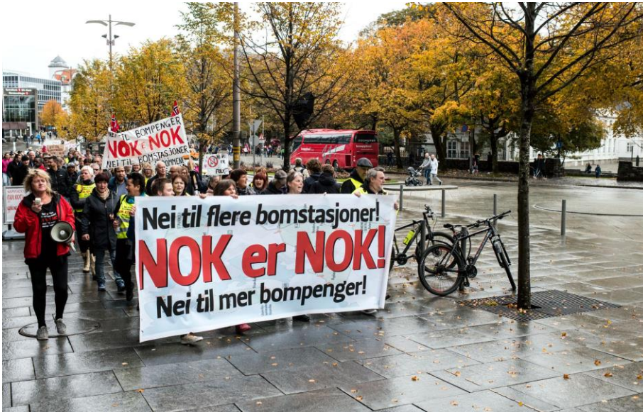
Demonstrasjon mot bompenger i Stavanger sentrum i 2018.

– Nok er nok, ropte bompengemotstandere i 2018. Noen av dem ble valgt inn i kommunestyrene i Rogaland. Nå har 7 av 17 innvalgte fått nok, og meldt seg ut av Folkets Parti.